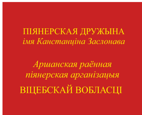
Знамя пионерской дружины (оборотная сторона)