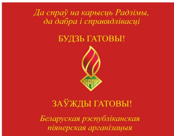
Знамя пионерской дружины (лицевая сторона)