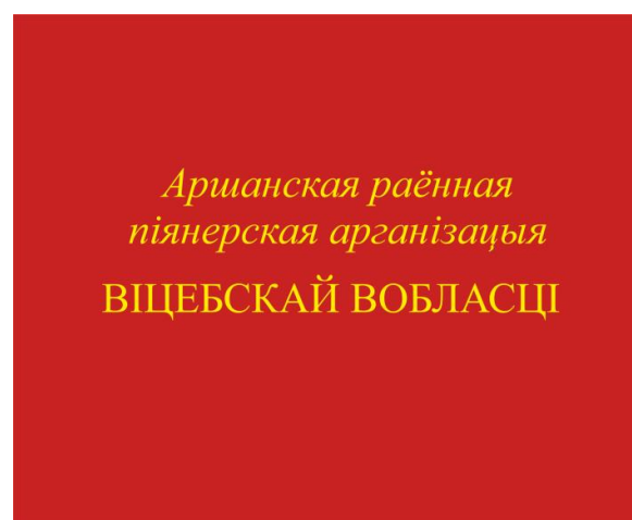
Знамя районной (городской) пионерской организации (оборотная сторона)