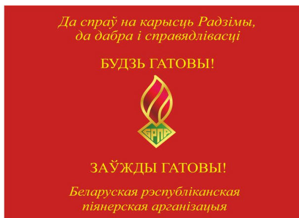
Знамя областной (Минской городской) пионерской организации (лицевая сторона)