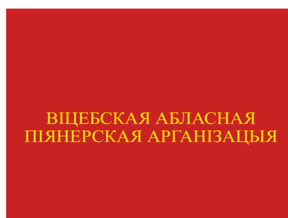
Знамя областной (Минской городской) пионерской организации (оборотная сторона)