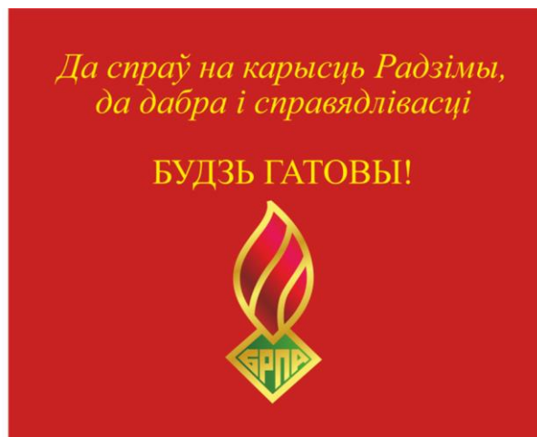
Знамя ОО «БРПО» (оборотная сторона)