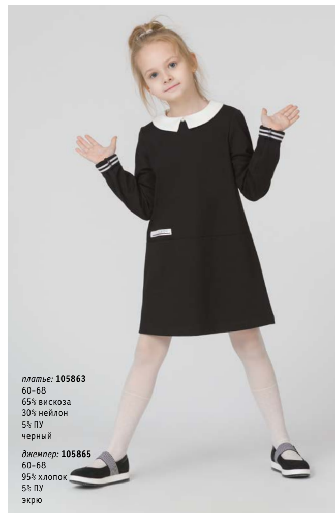
платье: 105863 60-68 65% вискоза 30% нейлон 5% ПУ черный