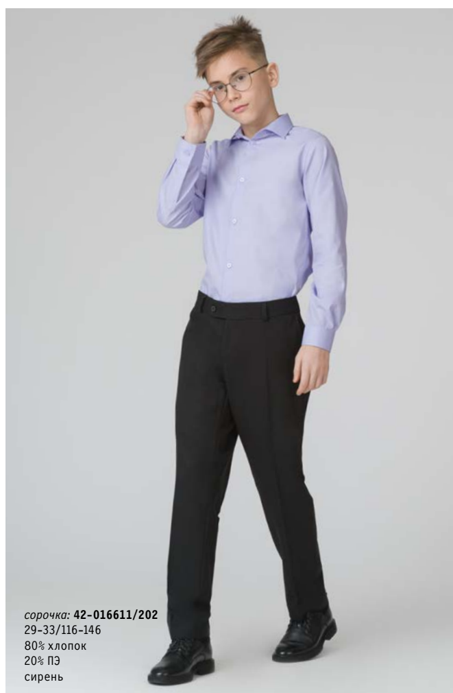
сорочка: 42-016611/202 29-33/116-146 80% хлопок 20% ПЭ сирень