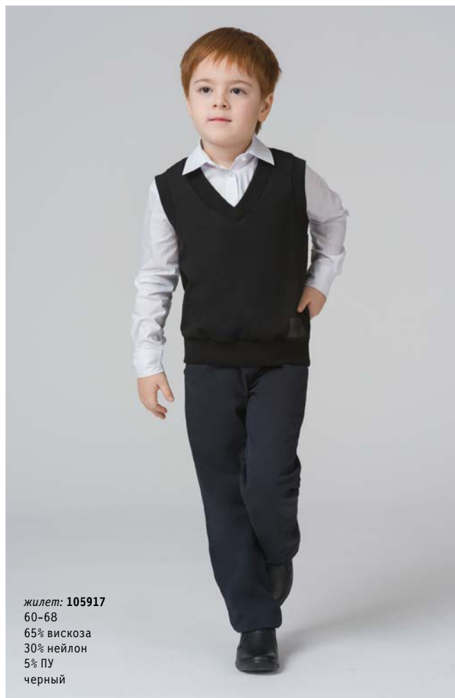
жилет: 105917 60-68 65% вискоза 30% нейлон 5% ПУ черный