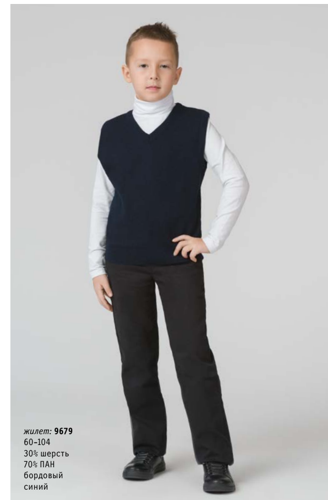
жилет: 9679 60-104 30% шерсть 70% ПАН бордовый синий