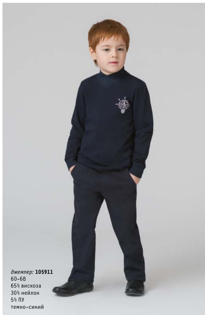
джерсер: 105911 60-68 65% вискоза 30% нейлон 5% ПУ темно-синий