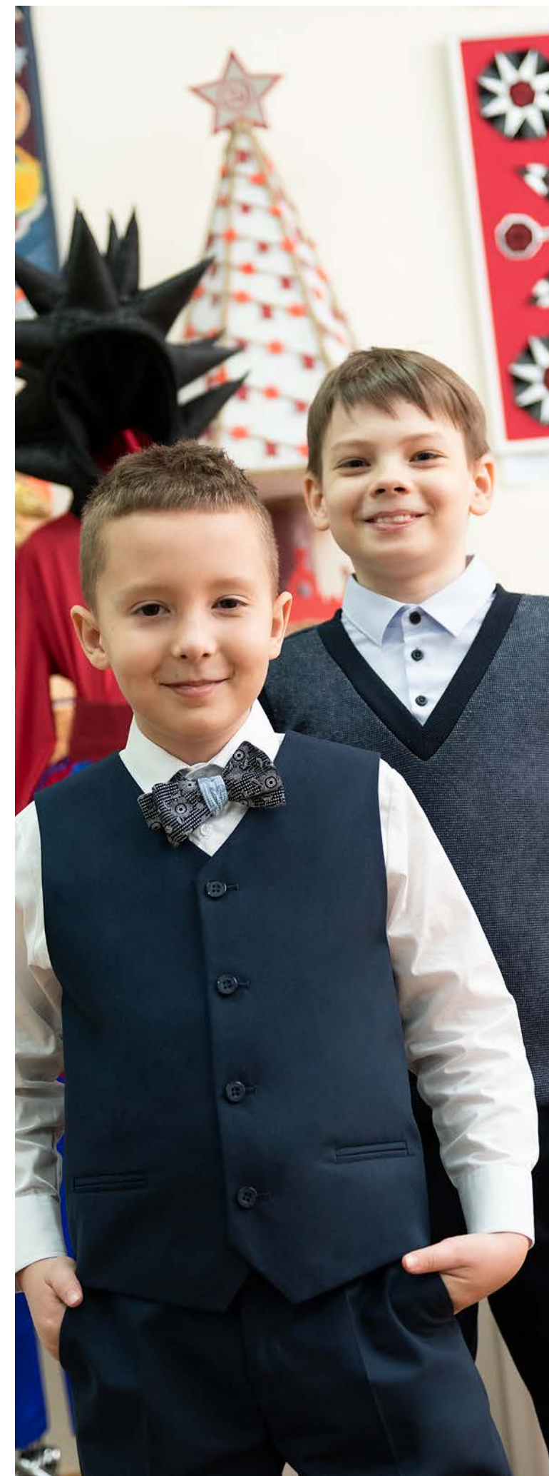
брюки: 20639-22/2 60-76/122-146 35% вискоза 63% ПЭ 2% лайкра синий