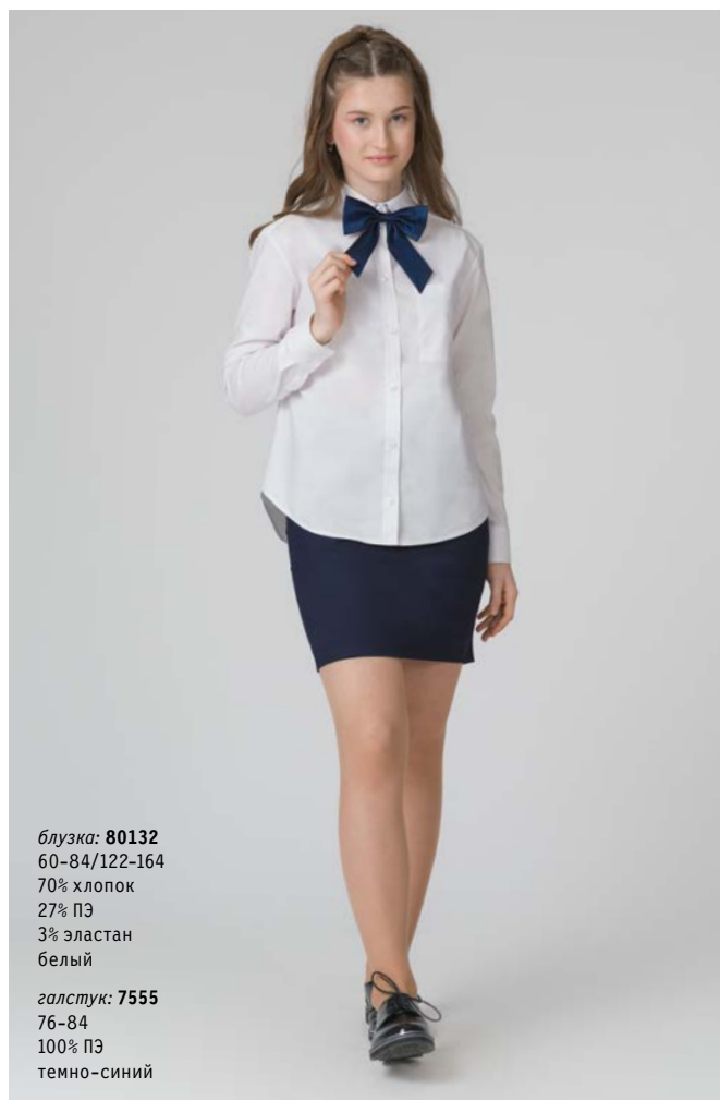
блузка: 80132 60-84/122-164 70% хлопок 27% ПЭ 3% эластан белый галстук: 7555 76-84 100% ПЭ темно-синий