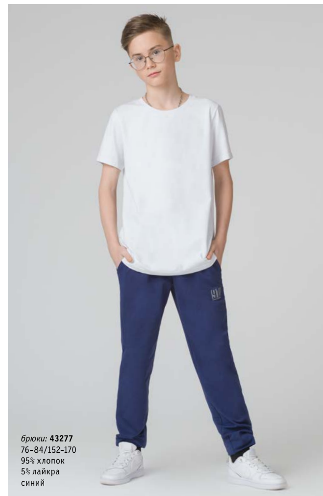
брюки: 43277 76-84/152-170 95% хлопок 5% лайкра синий