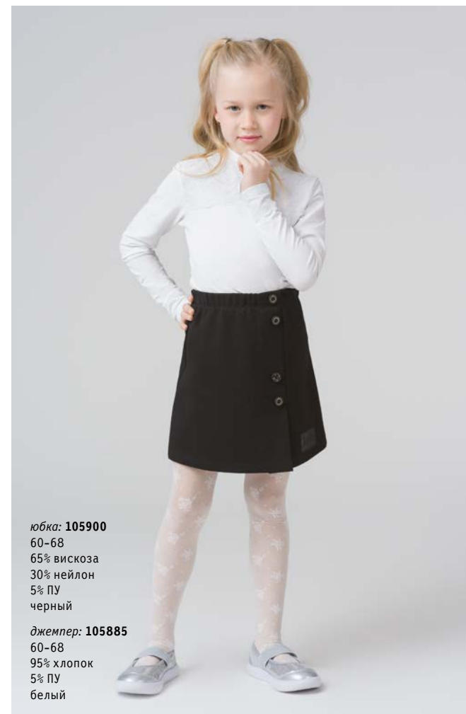
юбка: 105900 60-68 65% вискоза 30% нейлон 5% ПУ черный