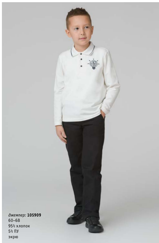
джерсер: 105909 60-68 95% хлопок 5% ПУ экрю