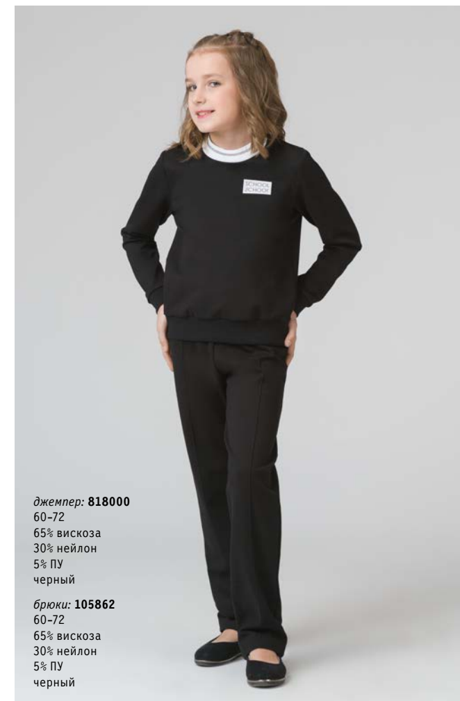
джерсер: 818000 60-72 65% вискоза 30% нейлон 5% ПУ черный