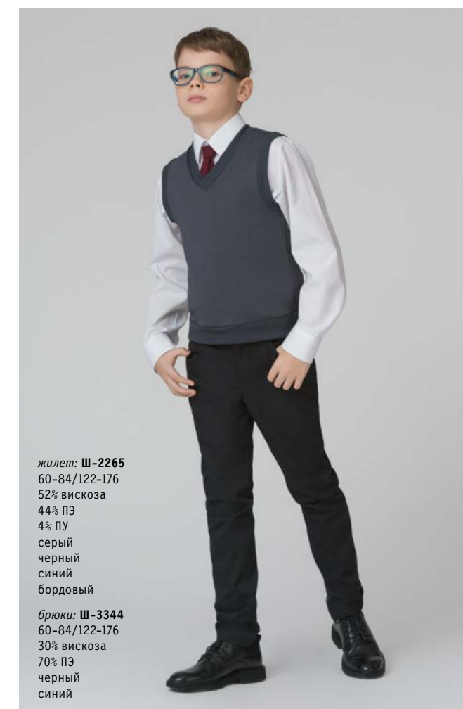
жилет: Ш-2265 60-84/122-176 52% вискоза 44% ПЭ 4% ПУ серый черный синий бордовый брюки: Ш-3344 60-84/122-176 30% вискоза 70% ПЭ черный синий