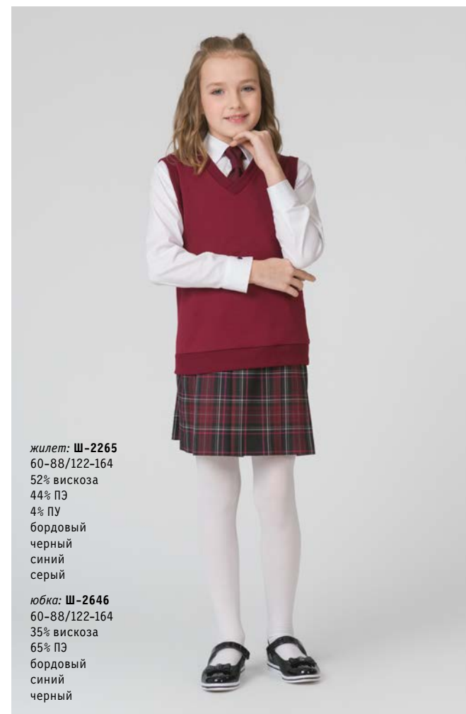
жилет: Ш-2265 60-88/122-164 52% вискоза 44% ПЭ 4% ПУ бордовый черный синий серый юбка: Ш-2646 60-88/122-164 35% вискоза 65% ПЭ бордовый синий черный