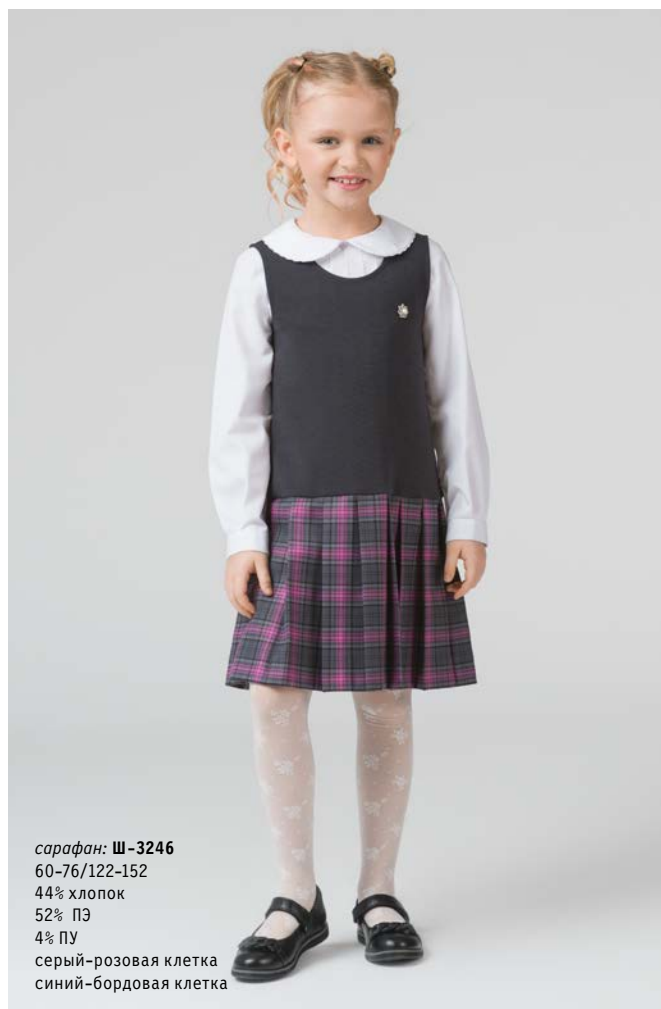
сарафан: Ш-3246 60-76/122-152 44% хлопок 52% ПЭ 4% ПУ серый-розовая клетка синий-бордовая клетка