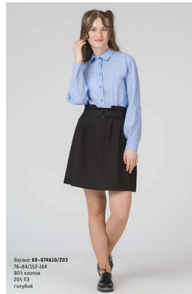
блузка: 60-074610/203 76-84/152-164 80% хлопок 20% ПЭ голубой