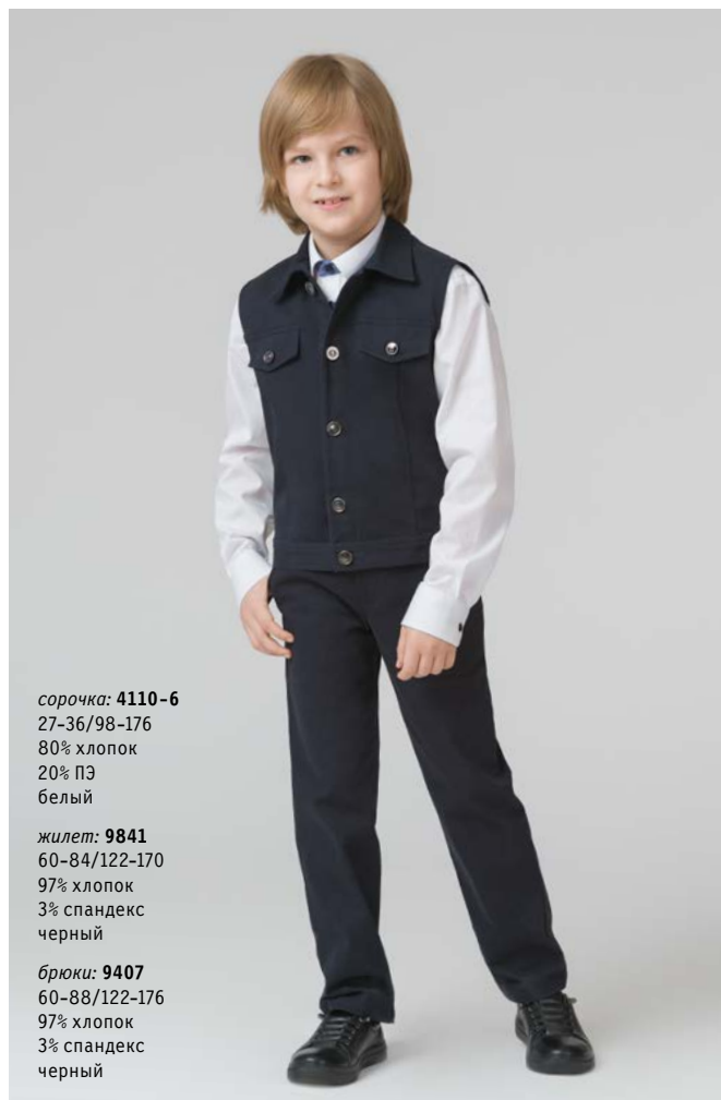
сорочка: 4110-6 27-36/98-176 80% хлопок 20% ПЭ белый жилет: 9841 60-84/122-170 97% хлопок 3% спандекс черный брюки: 9407 60-88/122-176 97% хлопок 3% спандекс черный