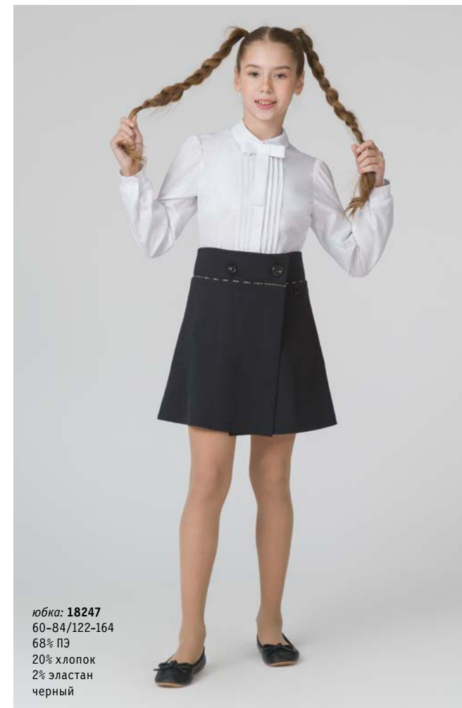
юбка: 18247 60-84/122-164 68% ПЭ 20% хлопок 2% эластан черный