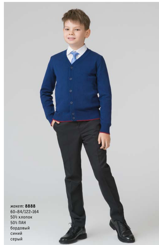
жакет: 8888 60-84/122-164 50% хлопок 50% ПАН бордовый синий серый