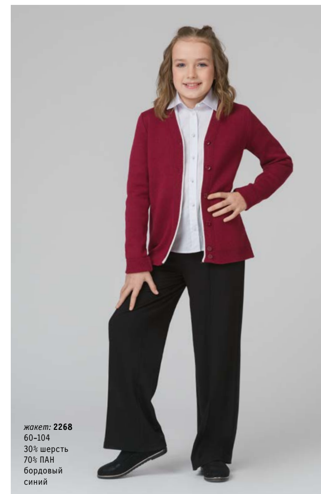
жакет: 2268 60-104 30% шерсть 70% ПАН бордовый синий

Коллекция состоит из изделий для девочек и мальчиков в классических расцветках. Правильный крой и эластичные ткани идеально подходят на любую комплекцию и помогают правильно расставлять акценты. Безупречное качество делает одежду удобной и практичной в ежедневной носке.