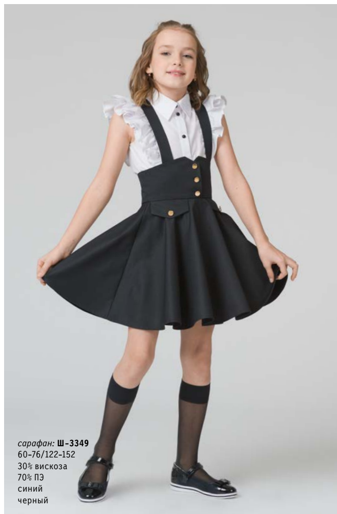
сарафан: Ш-3349 60-76/122-152 30% вискоза 70% ПЭ синий черный