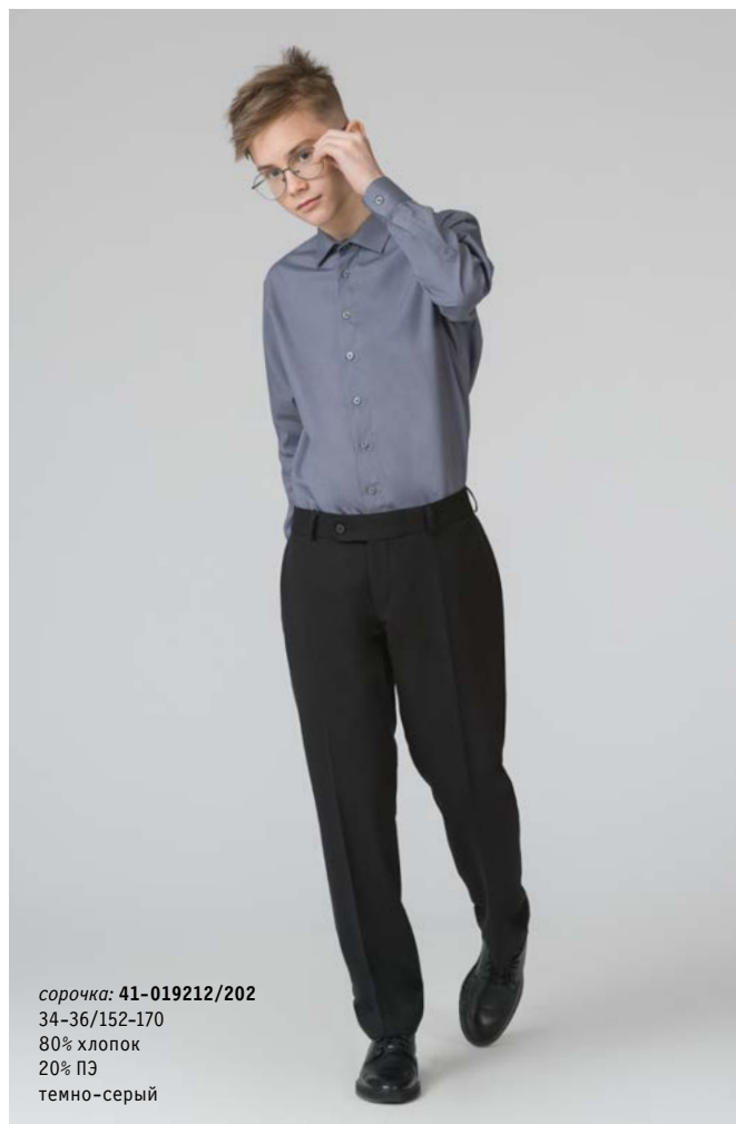
сорочка: 41-019212/202 34-36/152-170 80% хлопок 20% ПЭ темно-серый