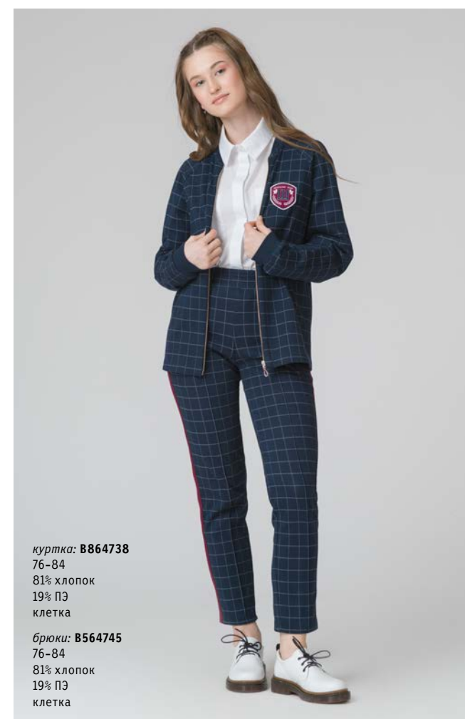
куртка: B864738 76-84 81% хлопок 19% ПЭ клетка