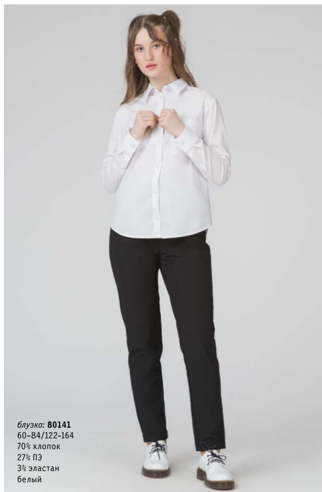
блузка: 80141 60-84/122-164 70% хлопок 27% ПЭ 3% эластан белый

Одежда SILVER GREY – это не просто одежда, а способ поиска своей индивидуальности и самовыражения.