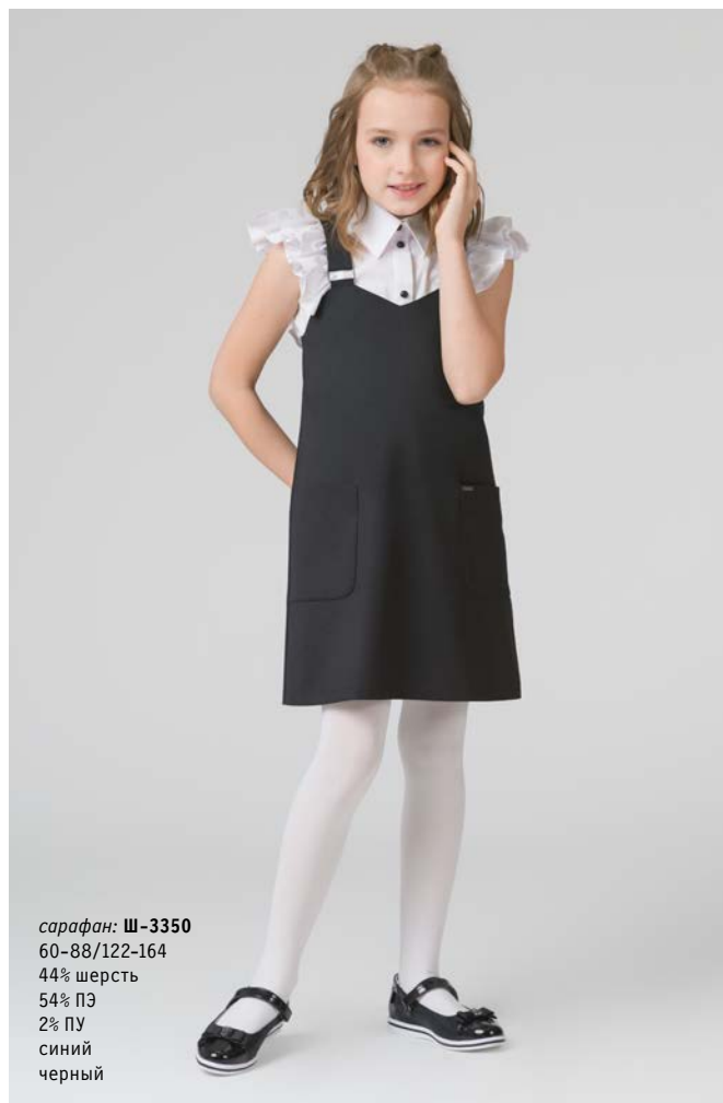
сарафан: Ш-3350 60-88/122-164 44% шерсть 54% ПЭ 2% ПУ синий черный