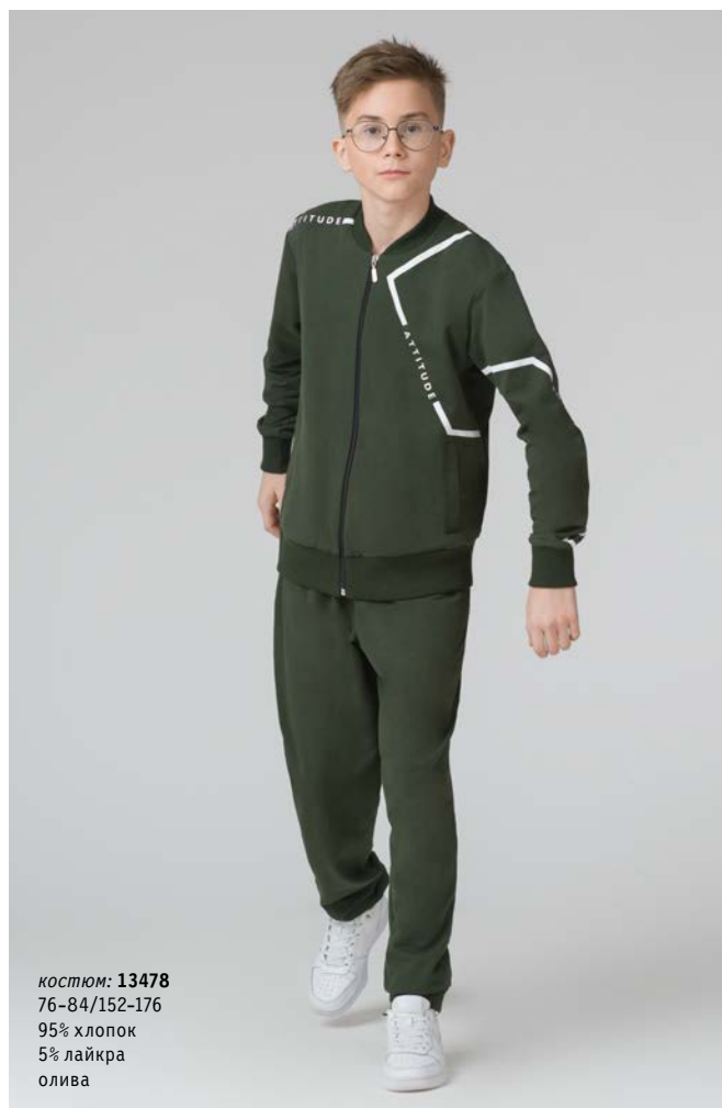
костюм: 13478 76-84/152-176 95% хлопок 5% лайкра олива

«ТОК» – энергия, импульс, движение, заряд.