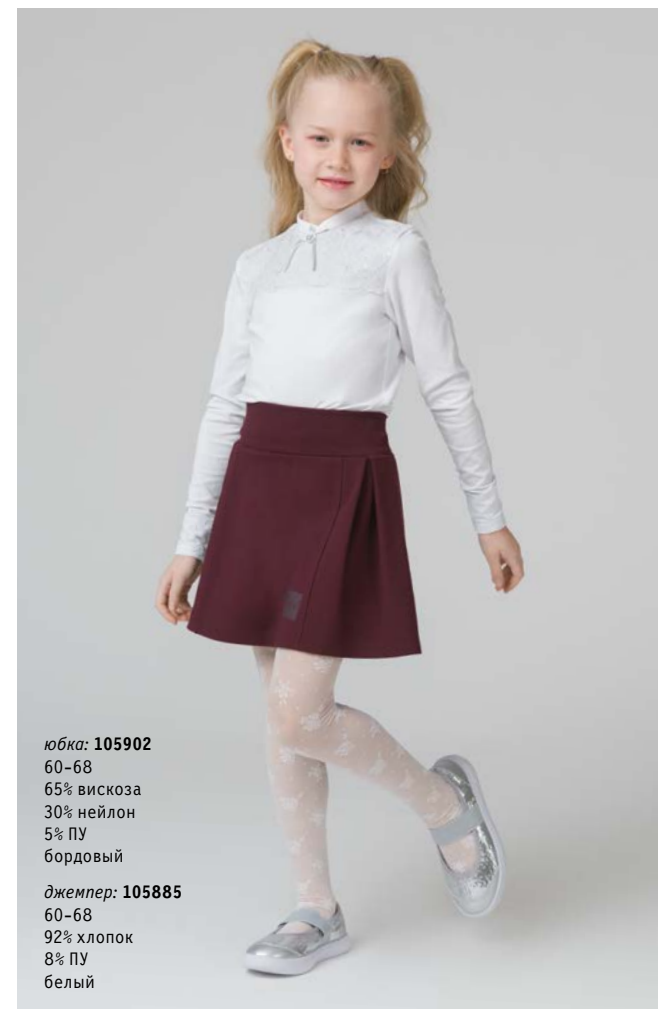
юбка: 105902 60-68 65% вискоза 30% нейлон 5% ПУ бордовый