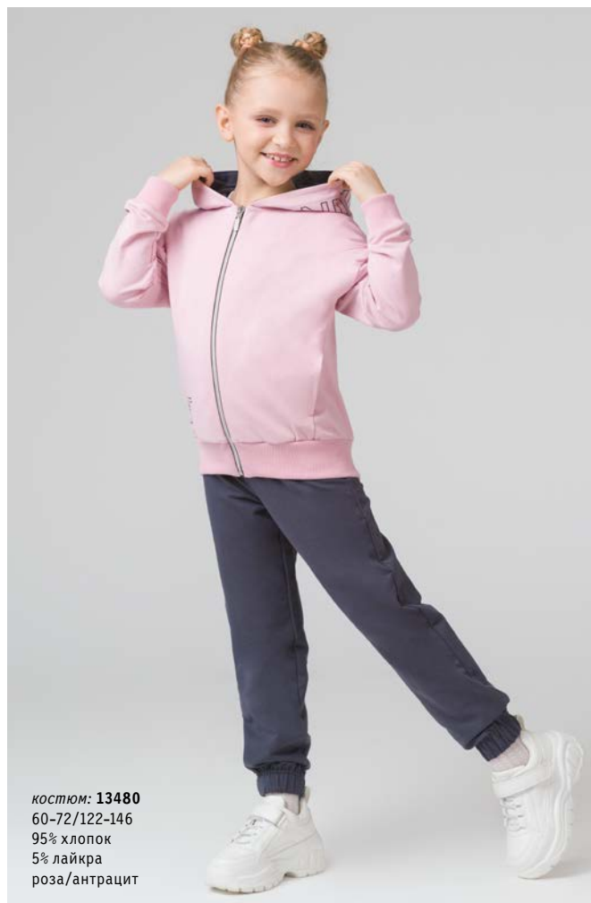
костюм: 13480 60-72/122-146 95% хлопок 5% лайкра роза/антрацит