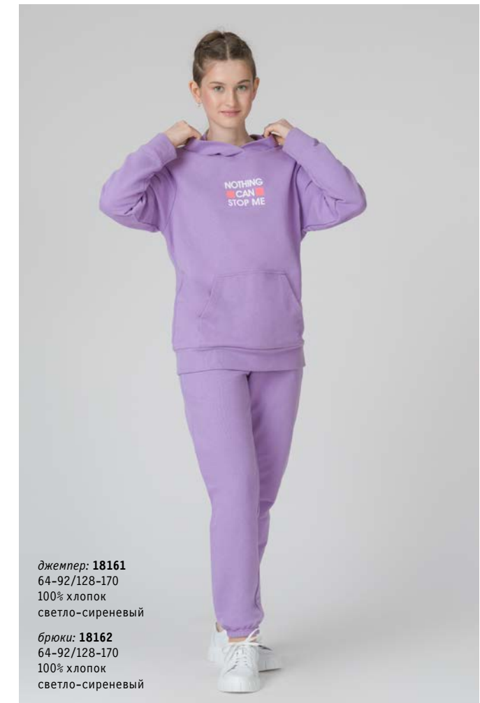
джерсер: 18161 64-92/128-170 100% хлопок светло-сиреневый брюки: 18162 64-92/128-170 100% хлопок светло-сиреневый