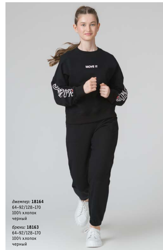
джерсер: 18164 64-92/128-170 100% хлопок черный брюки: 18163 64-92/128-170 100% хлопок черный