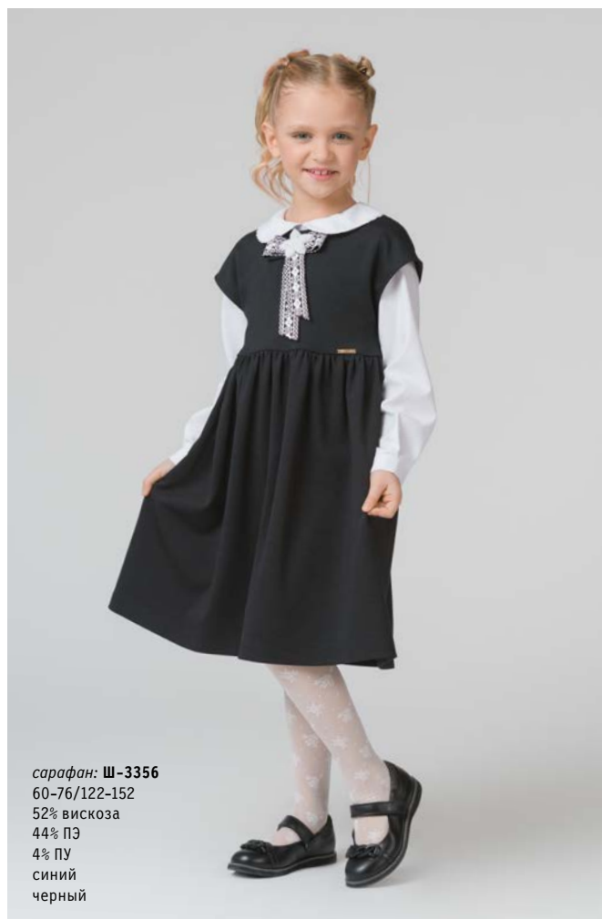
сарафан: Ш-3356 60-76/122-152 52% вискоза 44% ПЭ 4% ПУ синий черный