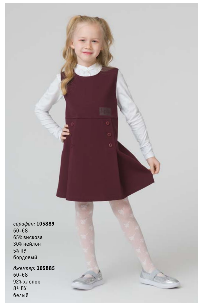
сарафан: 105889 60-68 65% вискоза 30% нейлон 5% ПУ бордовый