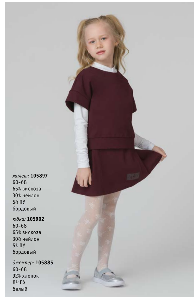
жилет: 105897 60-68 65% вискоза 30% нейлон 5% ПУ бордовый