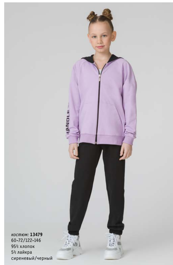
костюм: 13479 60-72/122-146 95% хлопок 5% лайкра сиреневый/черный