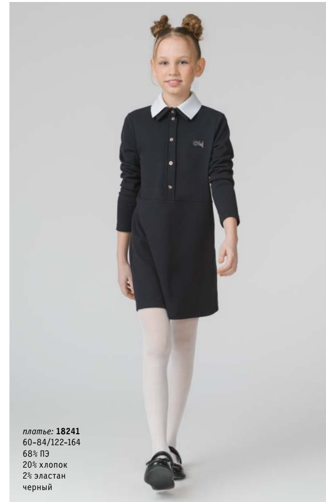
платье: 18241 60-84/122-164 68% ПЭ 20% хлопок 2% эластан черный