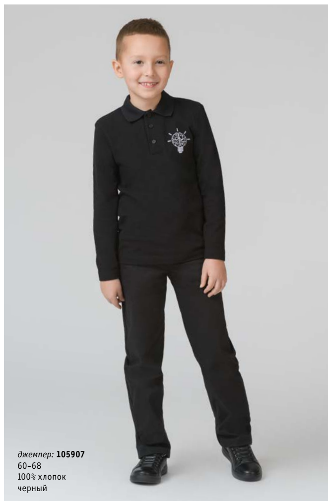
джерсер: 105907 60-68 100% хлопок черный