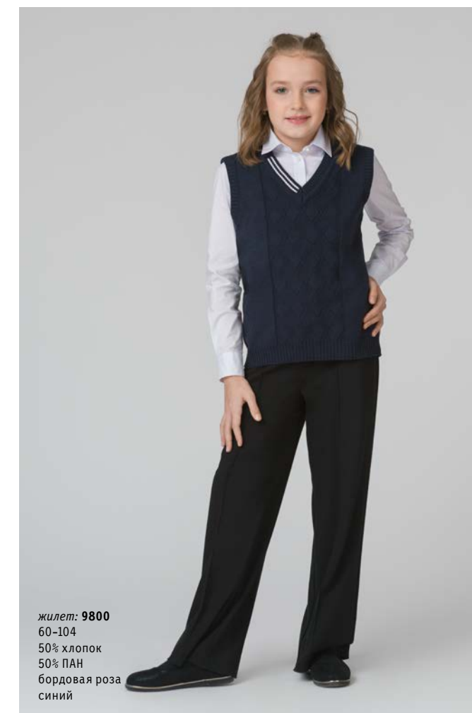
жилет: 9800 60-104 50% хлопок 50% ПАН бордовая роза синий