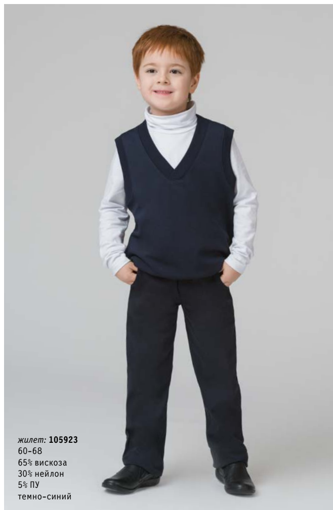
жилет: 105923 60-68 65% вискоза 30% нейлон 5% ПУ темно-синий