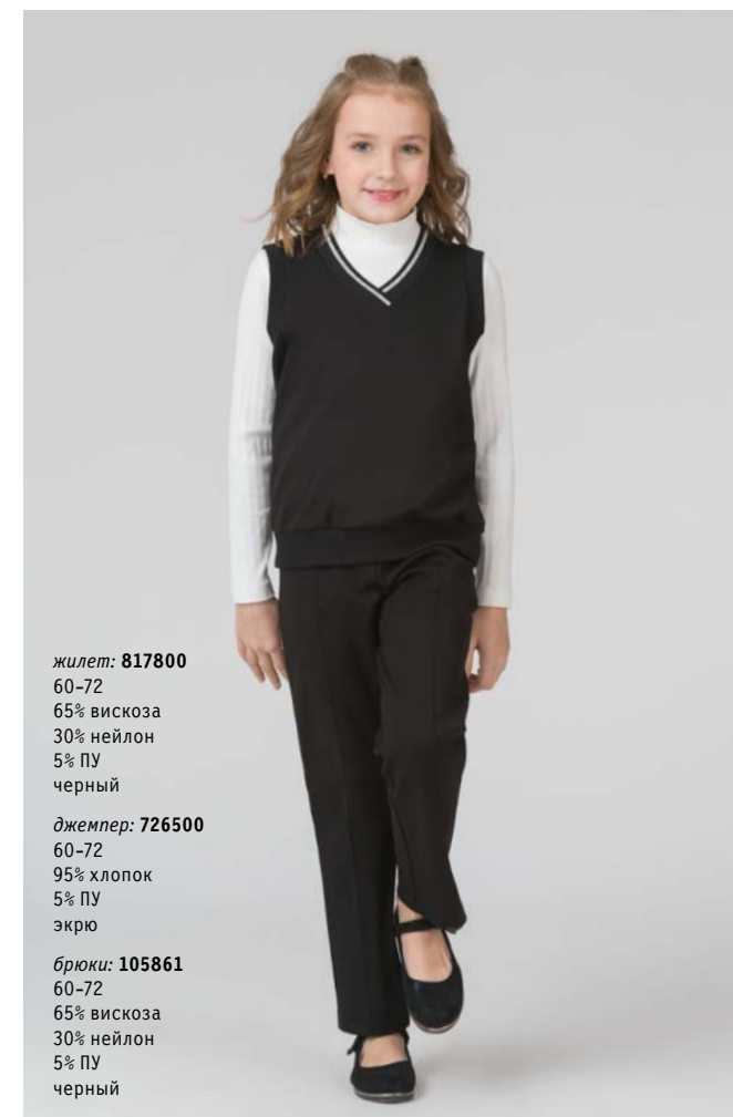
жилет: 817800 60-72 65% вискоза 30% нейлон 5% ПУ черный