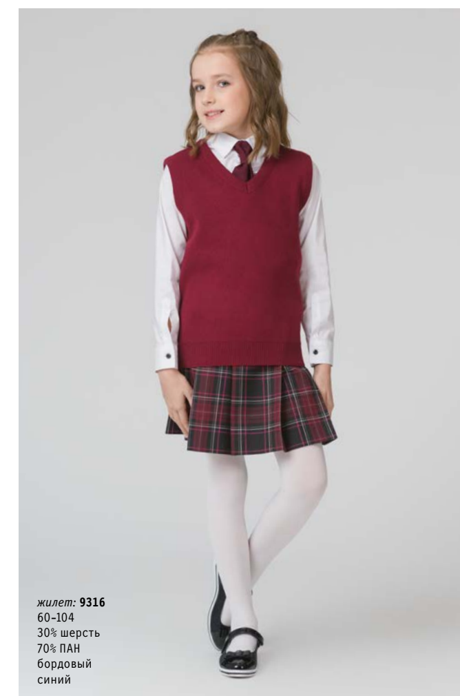
жилет: 9316 60-104 30% шерсть 70% ПАН бордовый синий