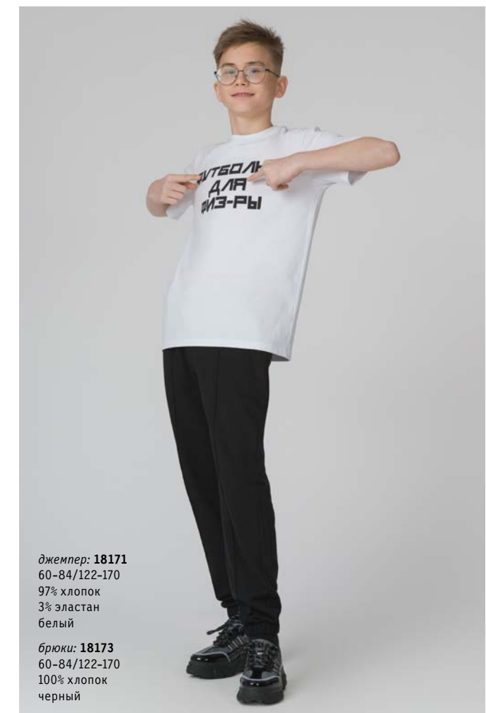
джерсер: 18171 60-84/122-170 97% хлопок 3% эластан белый брюки: 18173 60-84/122-170 100% хлопок черный