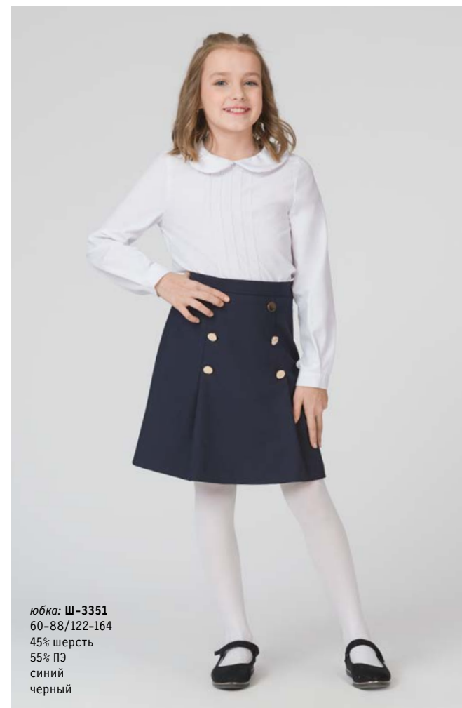
юбка: Ш-3351 60-88/122-164 45% шерсть 55% ПЭ синий черный