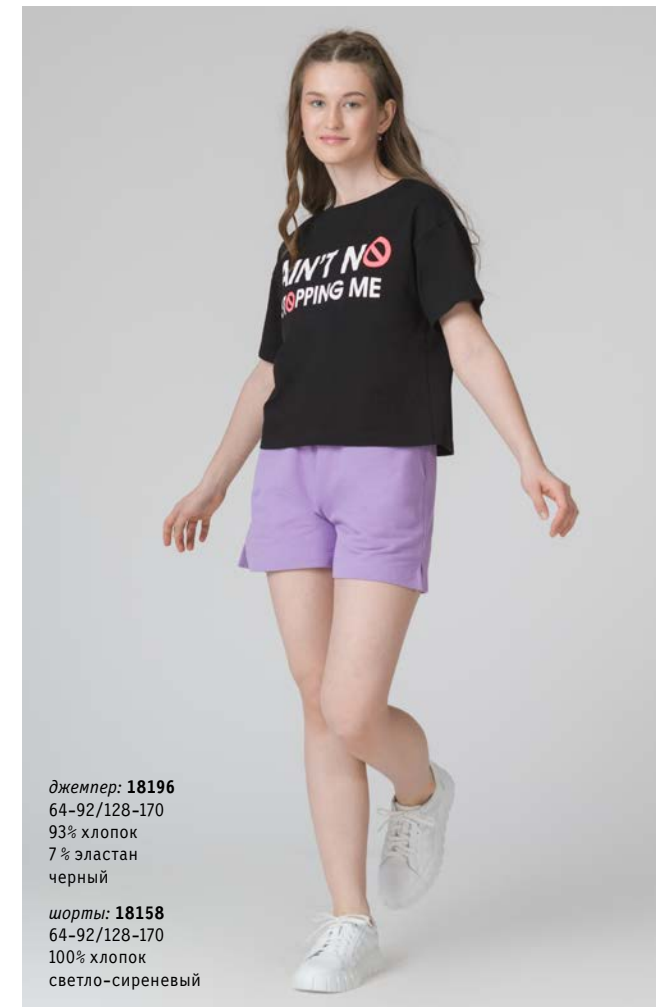
джерсер: 18196 64-92/128-170 93% хлопок 7% эластан черный шорты: 18158 64-92/128-170 100% хлопок светло-сиреневый