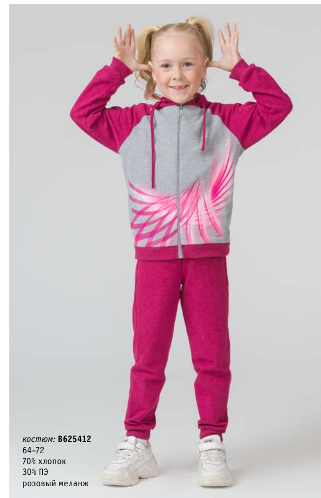
костюм: В625412 64-72 70% хлопок 30% ПЭ розовый меланж