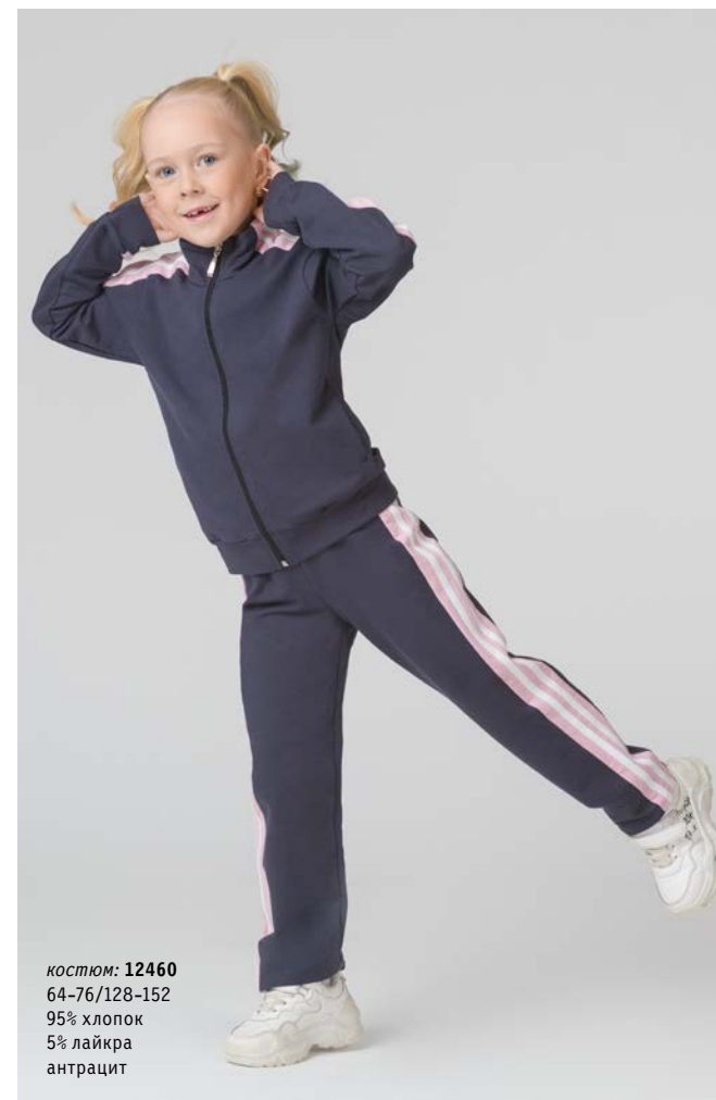
костюм: 12460 64-76/128-152 95% хлопок 5% лайкра антрацит