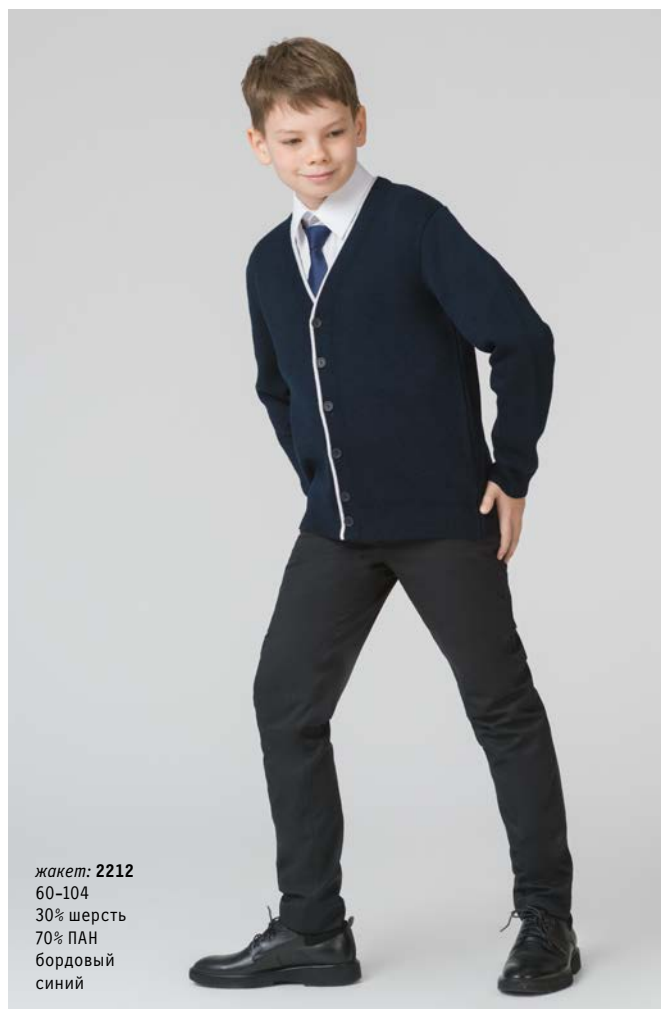
жакет: 2212 60-104 30% шерсть 70% ПАН бордовый синий