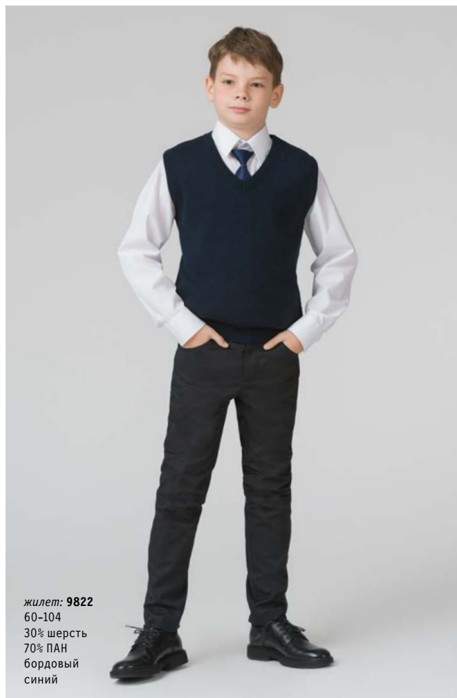
жилет: 9822 60-104 30% шерсть 70% ПАН бордовый синий