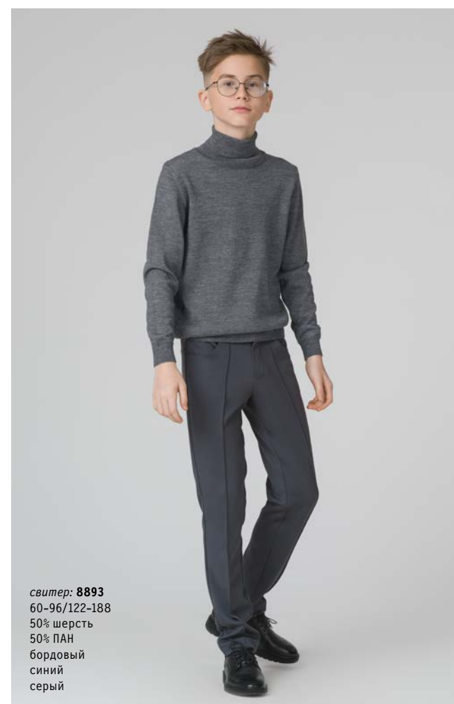
свитер: 8893 60-96/122-188 50% шерсть 50% ПАН бордовый синий серый