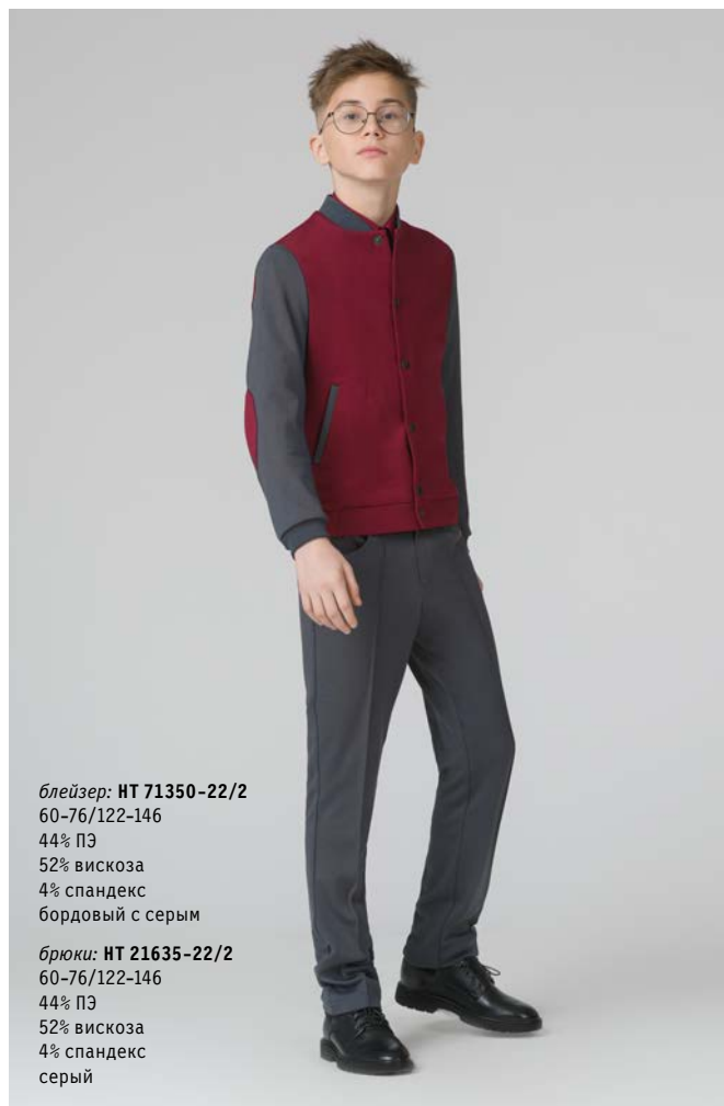
блейзер: НТ 71350-22/2 60-76/122-146 44% ПЭ 52% вискоза 4% спандекс бордовый с серым