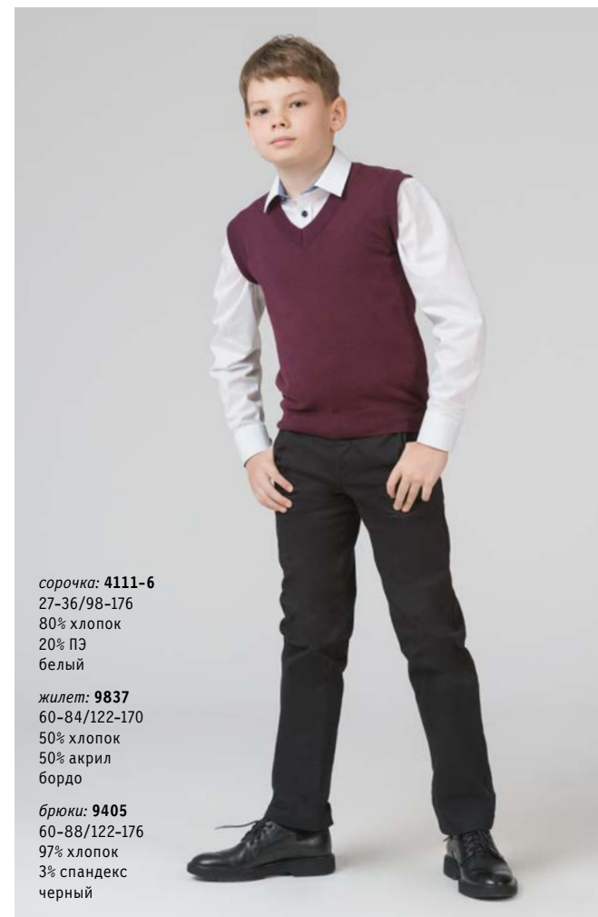
сорочка: 4111-6 27-36/98-176 80% хлопок 20% ПЭ белый жилет: 9837 60-84/122-170 50% хлопок 50% акрил бордо брюки: 9405 60-88/122-176 97% хлопок 3% спандекс черный