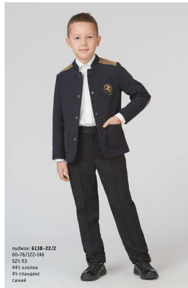
пиджак: 6138-22/2 60-76/122-146 52% ПЭ 44% хлопок 4% спандекс синий