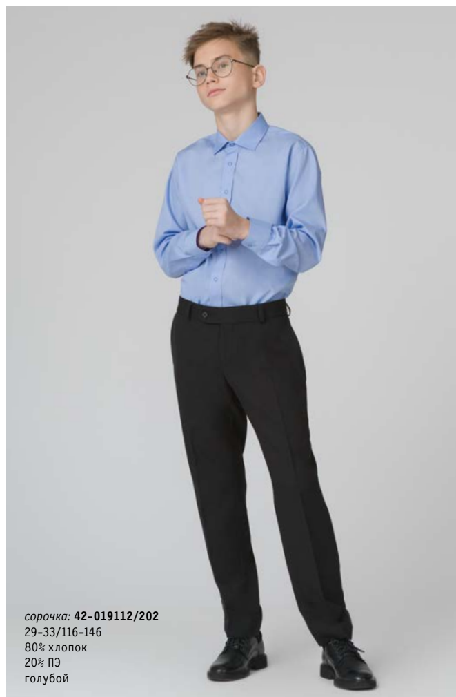
сорочка: 42-019112/202 29-33/116-146 80% хлопок 20% ПЭ голубой