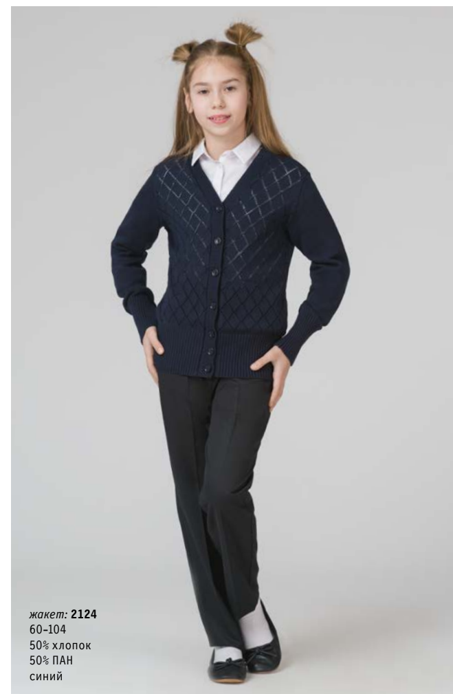
жакет: 2124 60-104 50% хлопок 50% ПАН синий