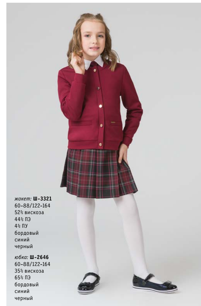
жакет: Ш-3321 60-88/122-164 52% вискоза 44% ПЭ 4% ПУ бордовый синий черный юбка: Ш-2646 60-88/122-164 35% вискоза 65% ПЭ бордовый синий черный