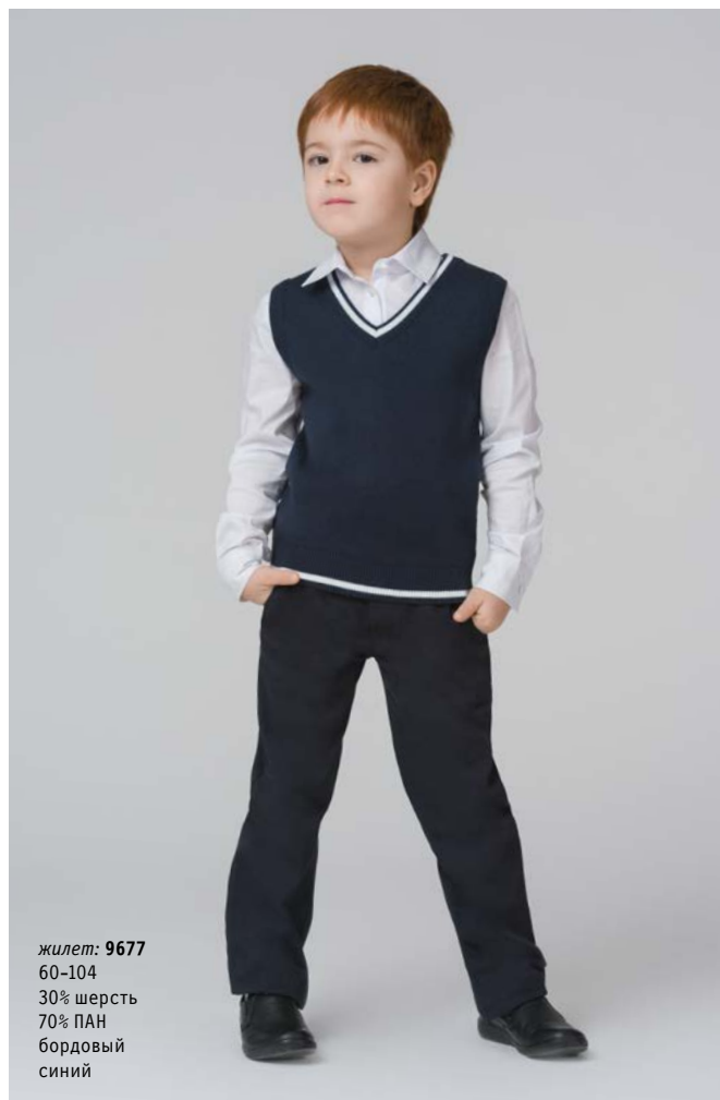
жилет: 9677 60-104 30% шерсть 70% ПАН бордовый синий