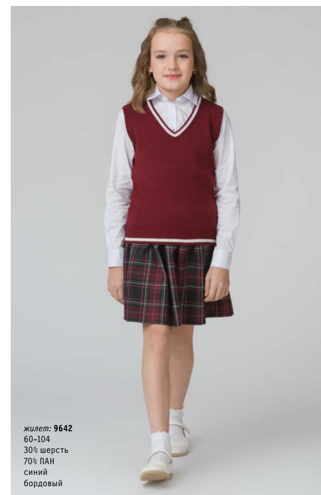
жилет: 9642 60-104 30% шерсть 70% ПАН синий бордовый