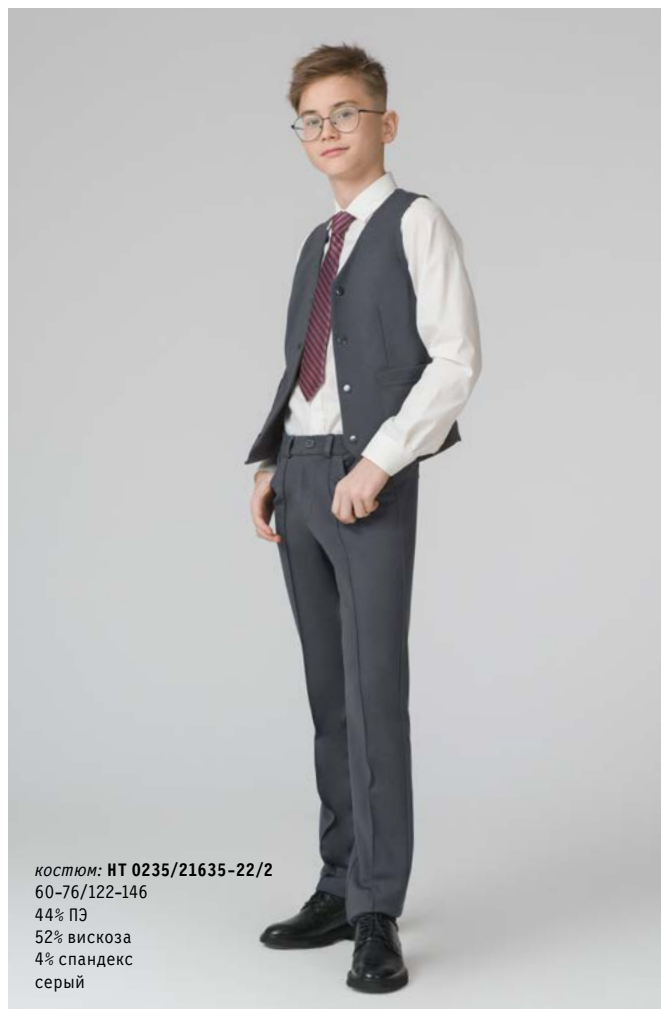
костюм: НТ 0235/21635-22/2 60-76/122-146 44% ПЭ 52% вискоза 4% спандекс серый