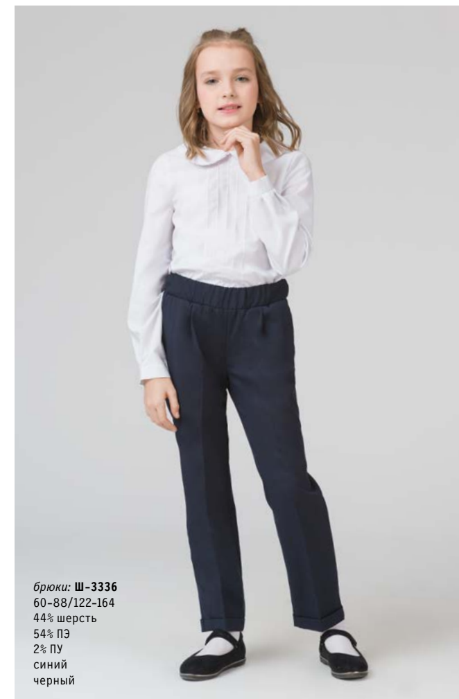
брюки: Ш-3336 60-88/122-164 44% шерсть 54% ПЭ 2% ПУ синий черный