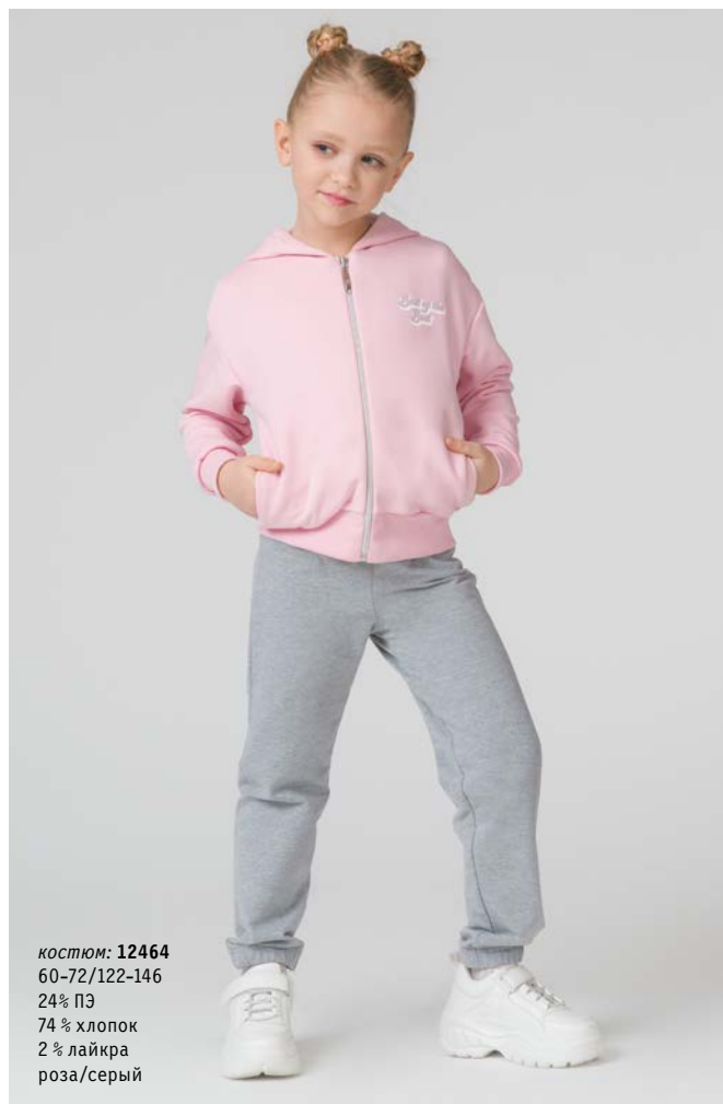
костюм: 12464 60-72/122-146 24% ПЭ 74% хлопок 2% лайкра роза/серый