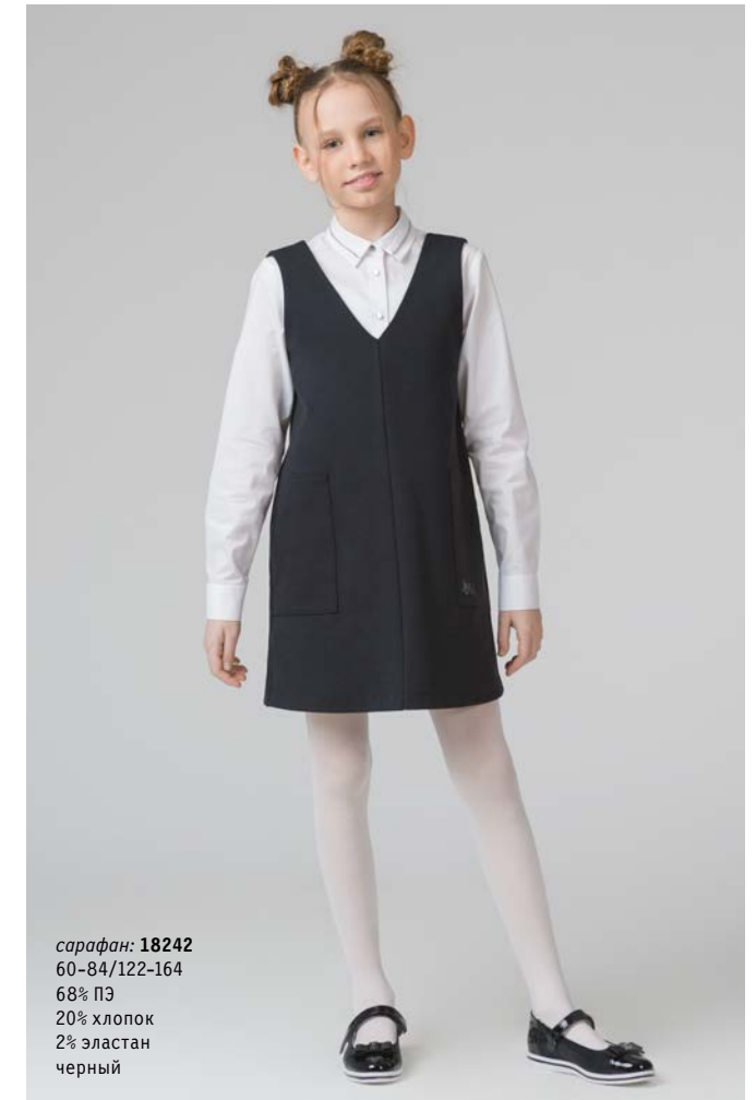
сарфан: 18242 60-84/122-164 68% ПЭ 20% хлопок 2% эластан черный