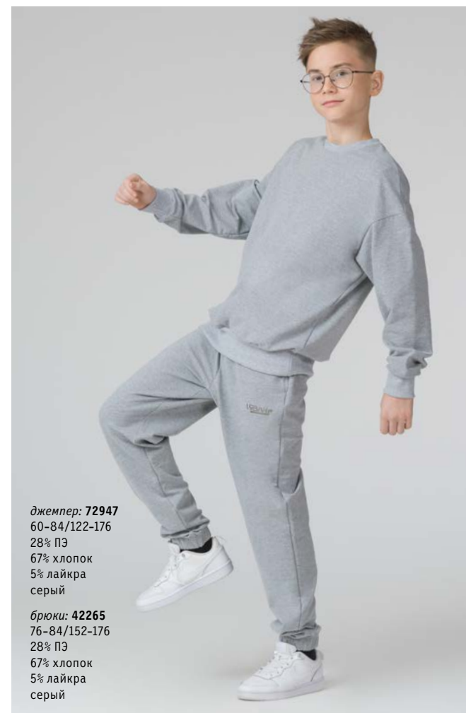
джерсер: 72947 60-84/122-176 28% ПЭ 67% хлопок 5% лайкра серый брюки: 42265 76-84/152-176 28% ПЭ 67% хлопок 5% лайкра серый