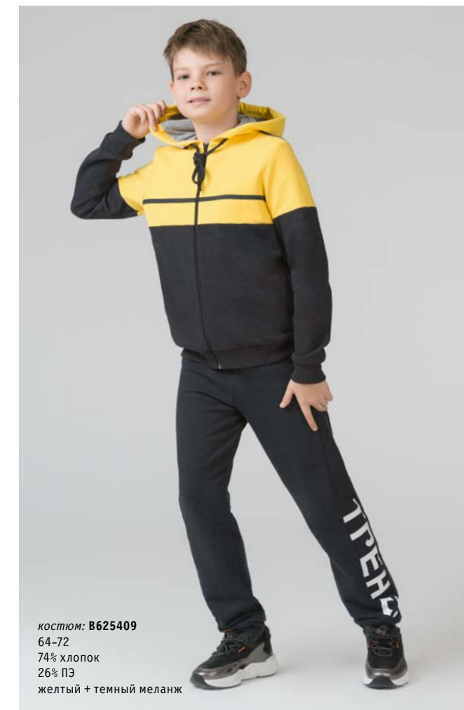
костюм: В625409 64-72 74% хлопок 26% ПЭ желтый + темный меланж