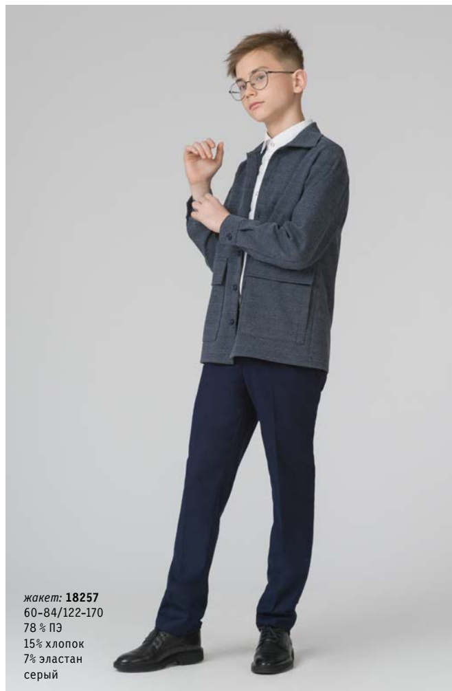
жакет: 18257 60-84/122-170 78% ПЭ 15% хлопок 7% эластан серый