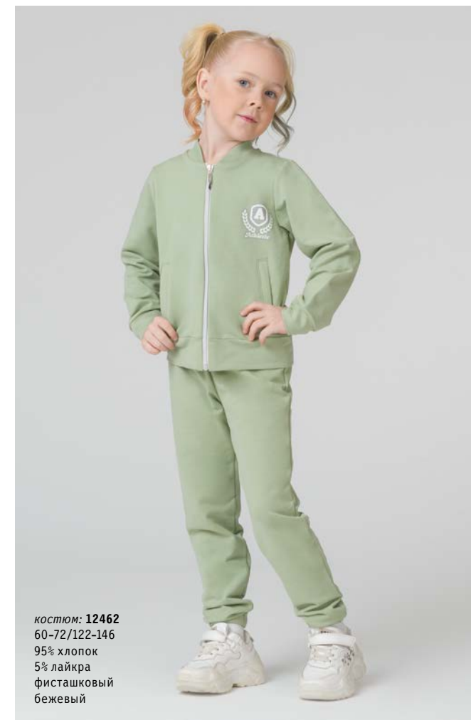
костюм: 12462 60-72/122-146 95% хлопок 5% лайкра фисташковый бежевый