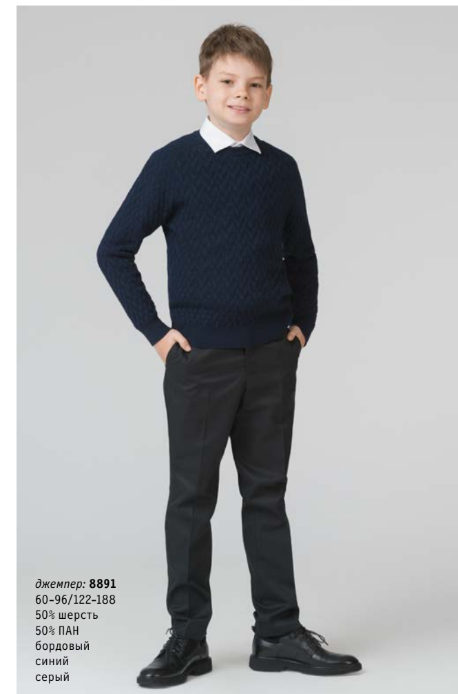
джерсер: 8891 60-96/122-188 50% шерсть 50% ПАН бордовый синий серый