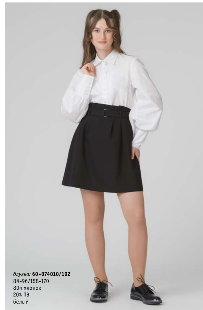
блузка: 60-074010/102 84-96/158-170 80% хлопок 20% ПЭ белый