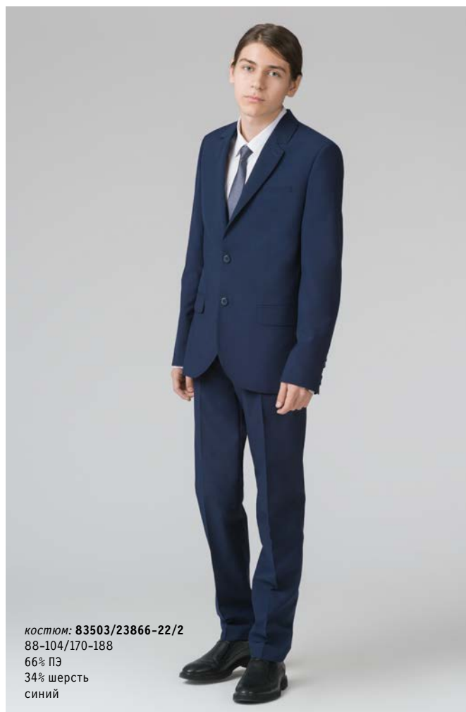
костюм: 83503/23866-22/2 88-104/170-188 66% ПЭ 34% шерсть синий