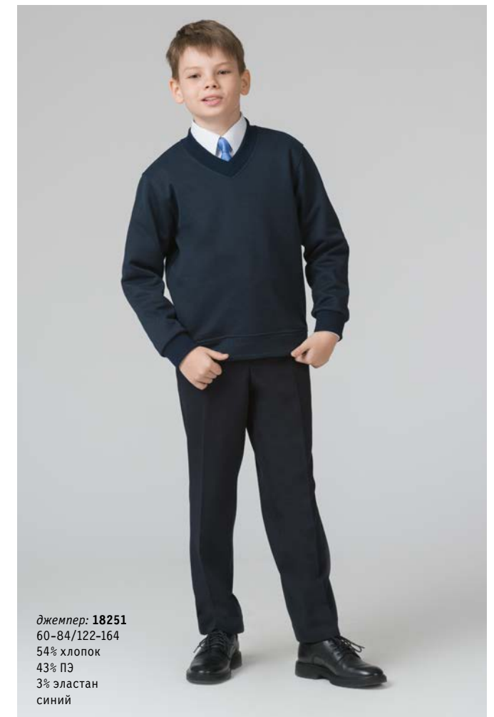
джерсер: 18251 60-84/122-164 54% хлопок 43% ПЭ 3% эластан синий