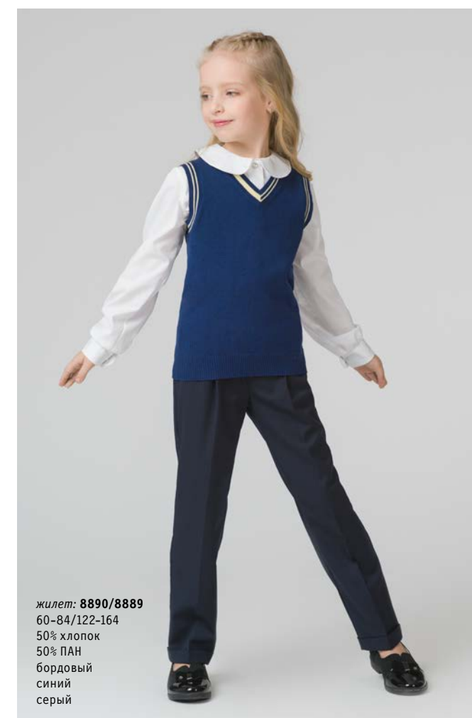
жилет: 8890/8889 60-84/122-164 50% хлопок 50% ПАН бордовый синий серый