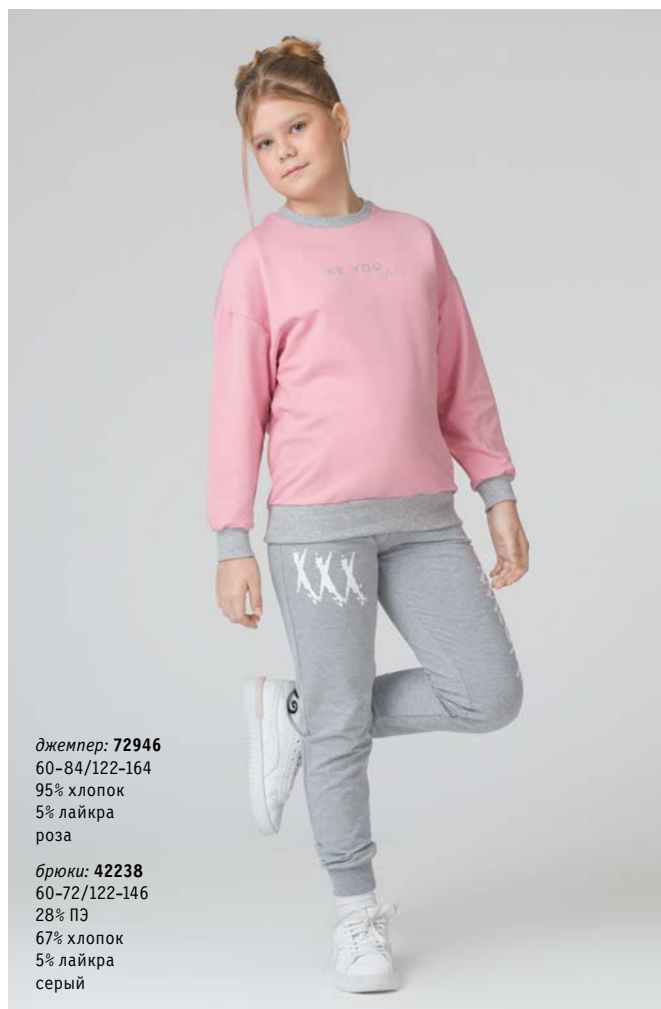
джерсер: 72946 60-84/122-164 95% хлопок 5% лайкра роза брюки: 42238 60-72/122-146 28% ПЭ 67% хлопок 5% лайкра серый