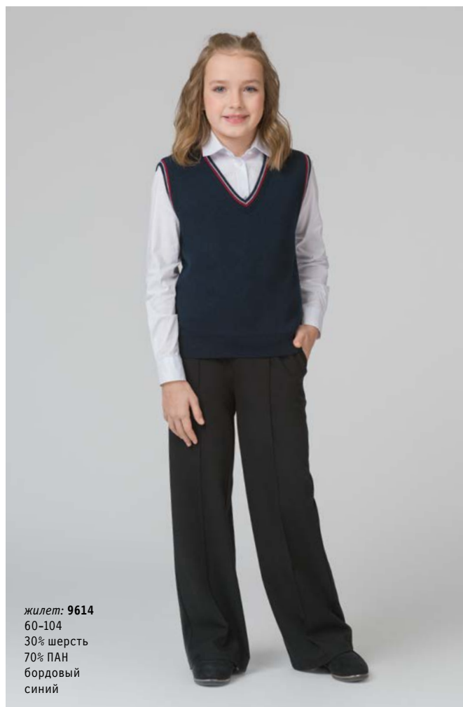
жилет: 9614 60-104 30% шерсть 70% ПАН бордовый синий