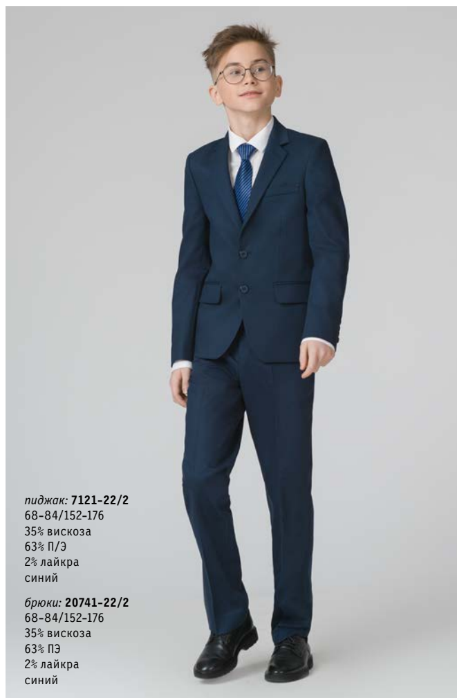
пиджак: 7121-22/2 68-84/152-176 35% вискоза 63% П/Э 2% лайкра синий