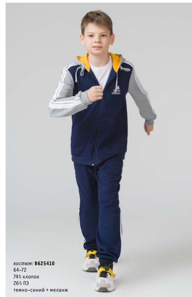
костюм: В625410 64-72 74% хлопок 26% ПЭ темно-синий + меланж