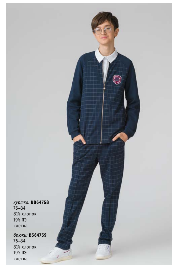
куртка: B864758 76-84 81% хлопок 19% ПЭ клетка