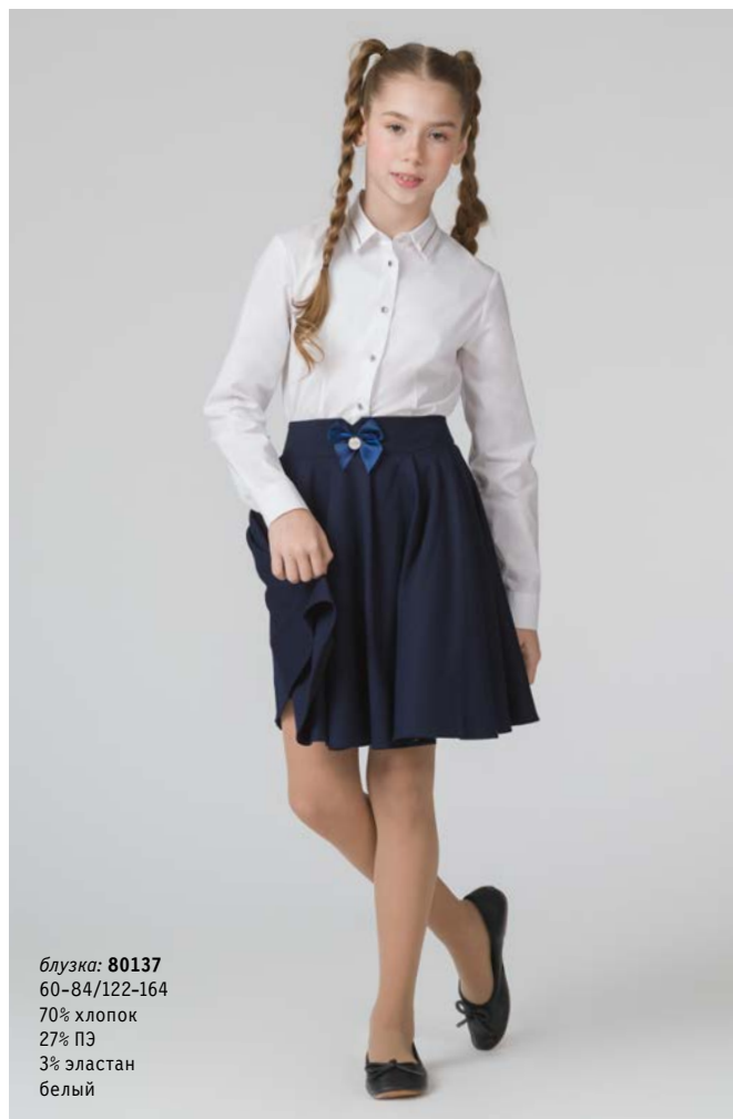
блузка: 80137 60-84/122-164 70% хлопок 27% ПЭ 3% эластан белый