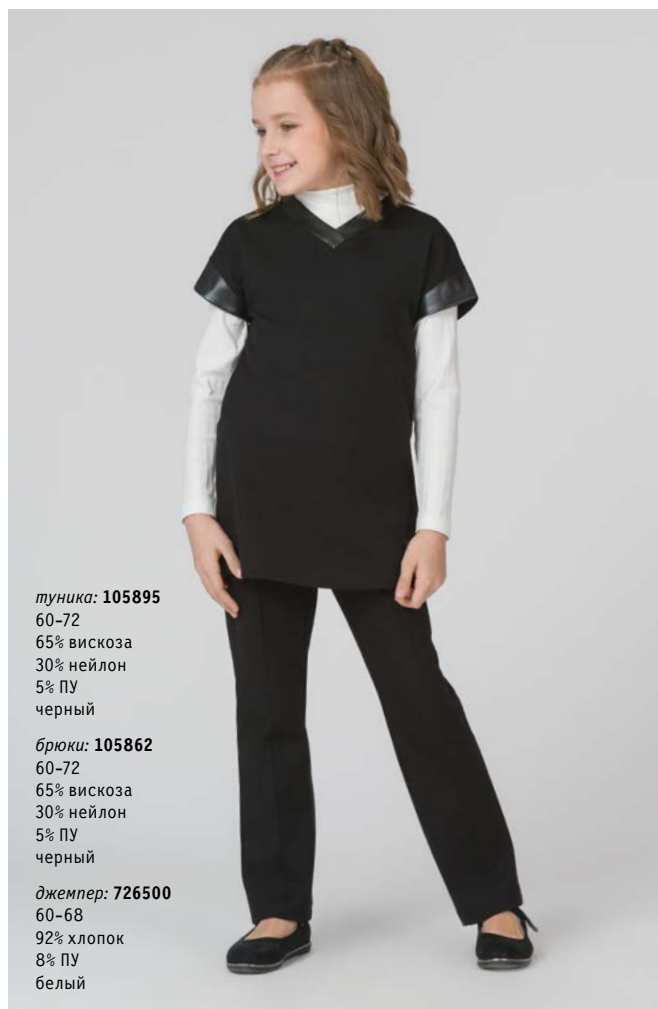
туника: 105895 60-72 65% вискоза 30% нейлон 5% ПУ черный