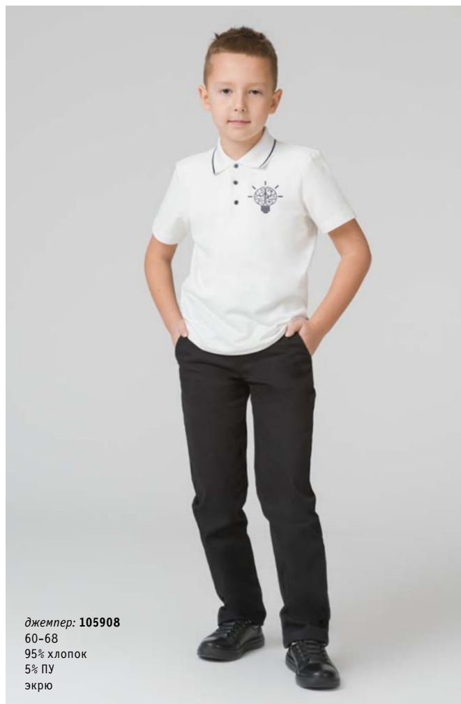
джерсер: 105908 60-68 95% хлопок 5% ПУ экрю