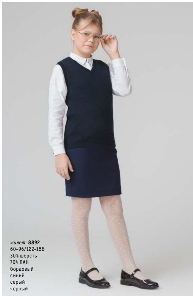
жилет: 8892 60-96/122-188 30% шерсть 70% ПАН бордовый синий серый черный

Качество продукции ОАО «Алеся» отвечает самым высоким Европейским критериям.