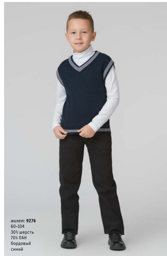
жилет: 9276 60-104 30% шерсть 70% ПАН бордовый синий