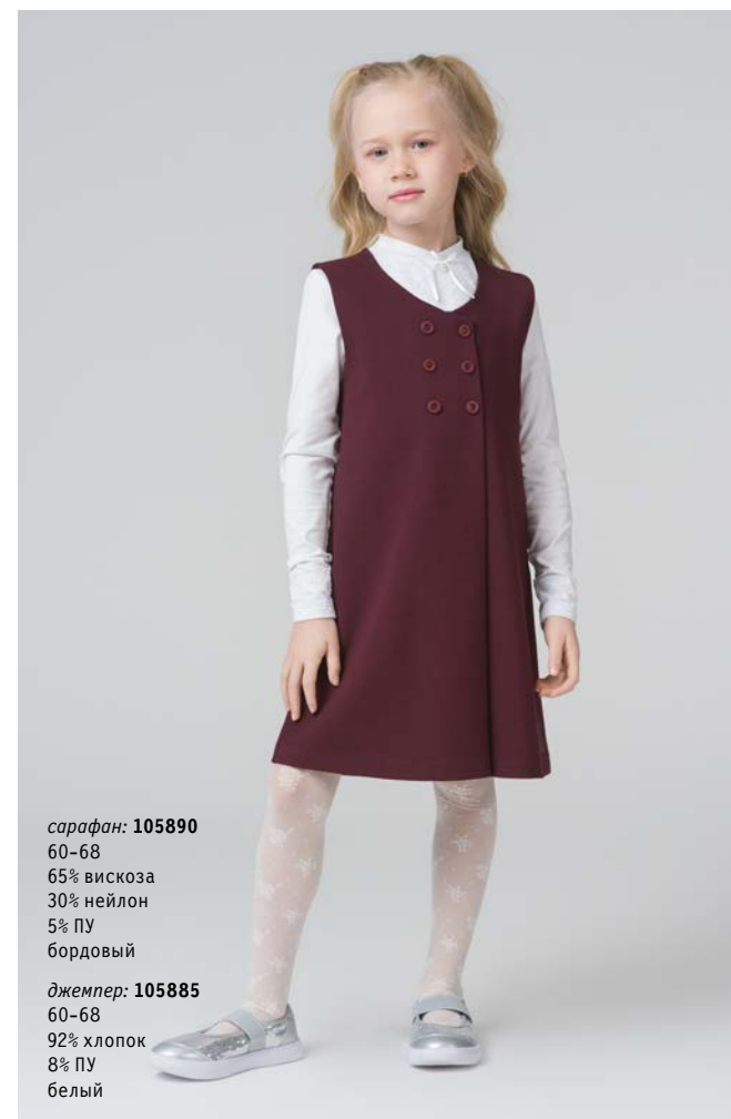
сарафан: 105890 60-68 65% вискоза 30% нейлон 5% ПУ бордовый