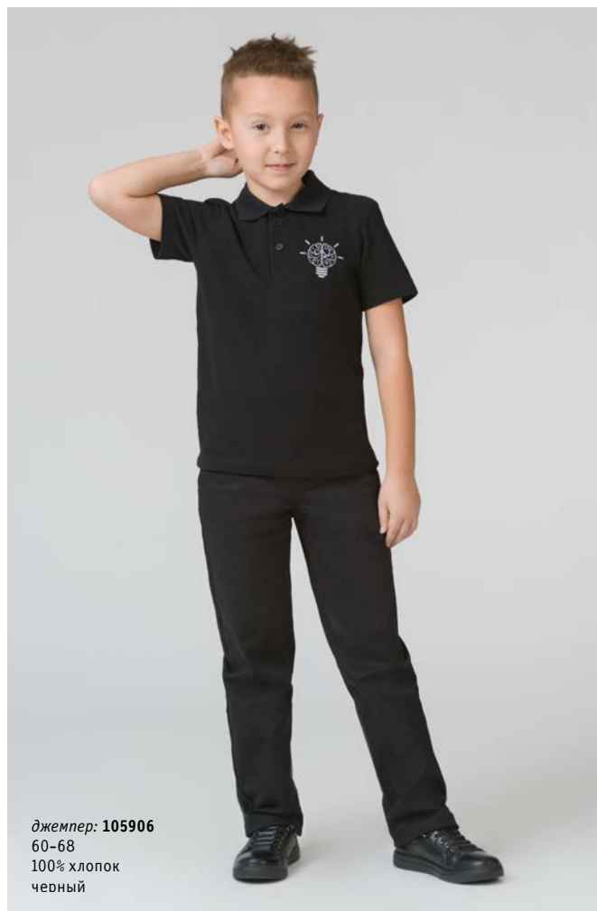
джерсер: 105906 60-68 100% хлопок черный