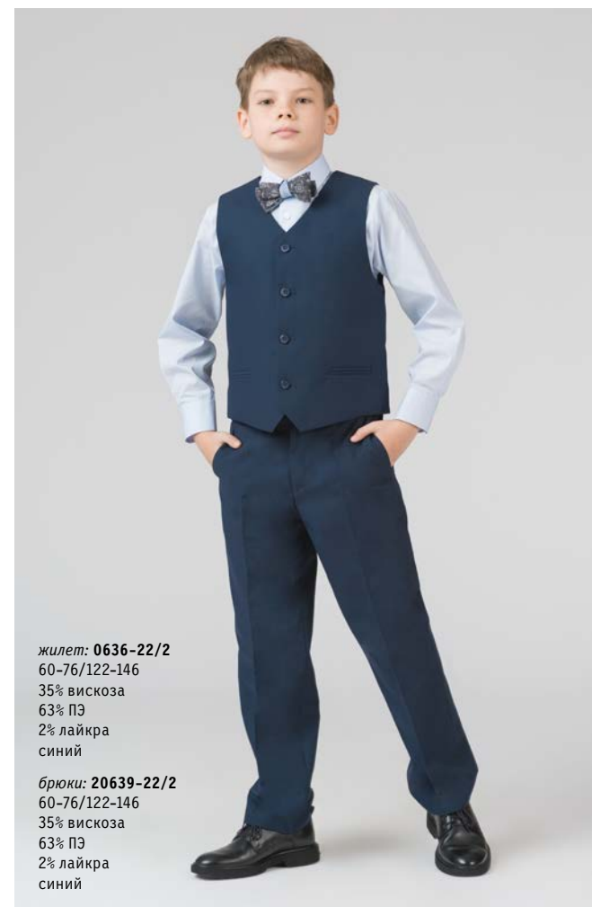
жилет: 0636-22/2 60-76/122-146 35% вискоза 63% ПЭ 2% лайкра синий