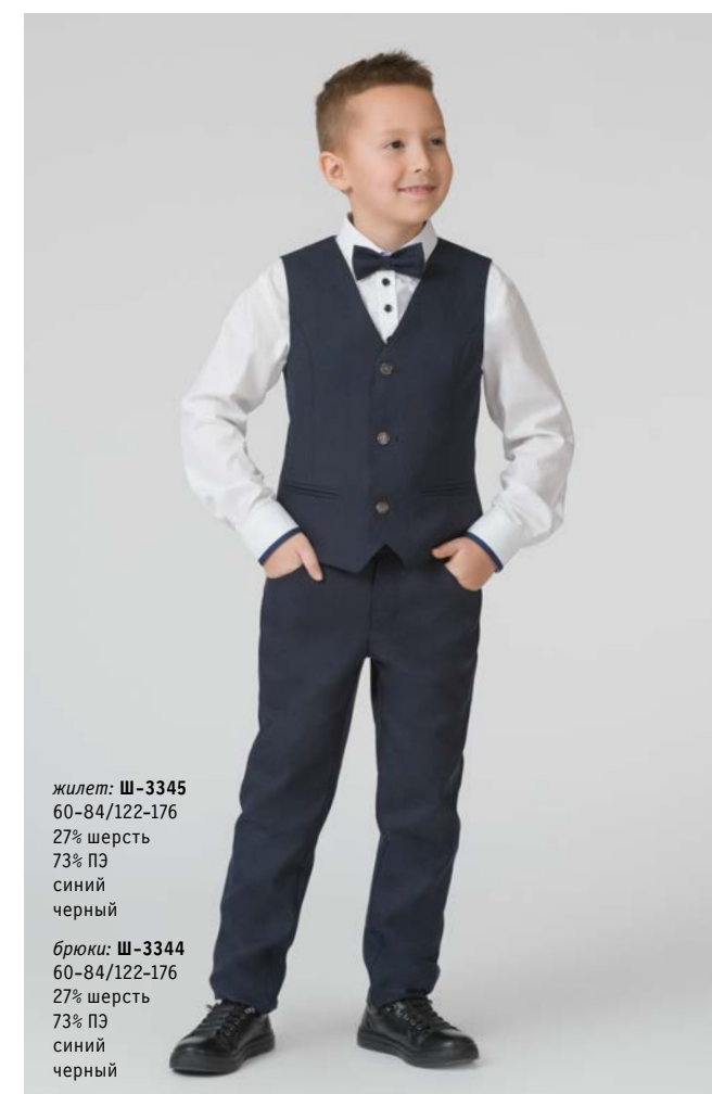
жилет: Ш-3345 60-84/122-176 27% шерсть 73% ПЭ синий черный брюки: Ш-3344 60-84/122-176 27% шерсть 73% ПЭ синий черный