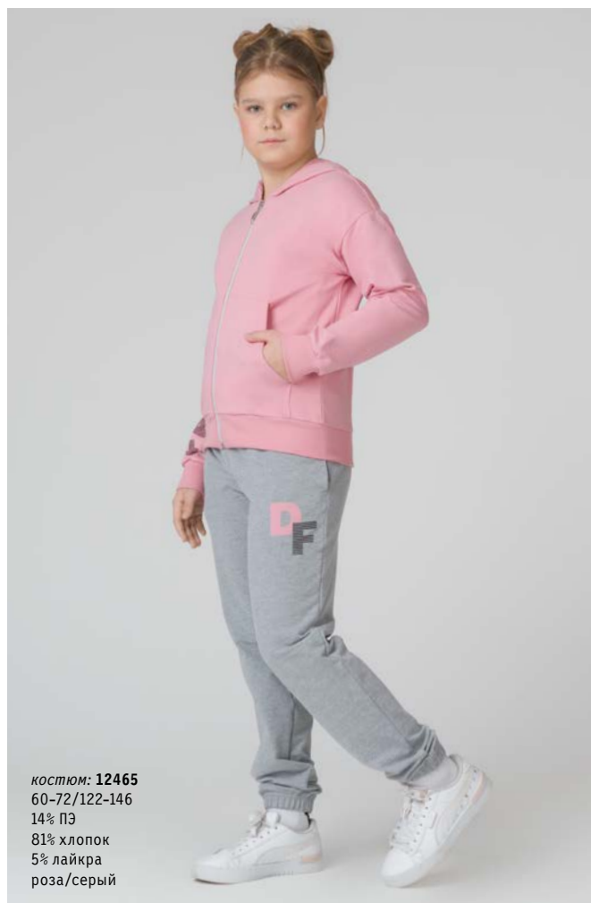
костюм: 12465 60-72/122-146 14% ПЭ 81% хлопок 5% лайкра роза/серый