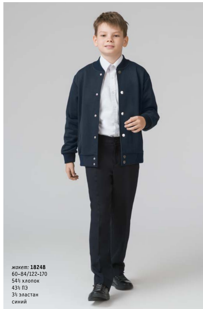
жакет: 18248 60-84/122-170 54% хлопок 43% ПЭ 3% эластан синий