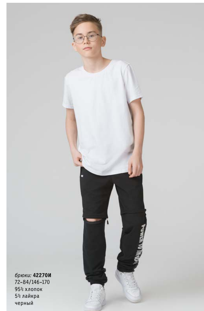
брюки: 42270И 72-84/146-170 95% хлопок 5% лайкра черный