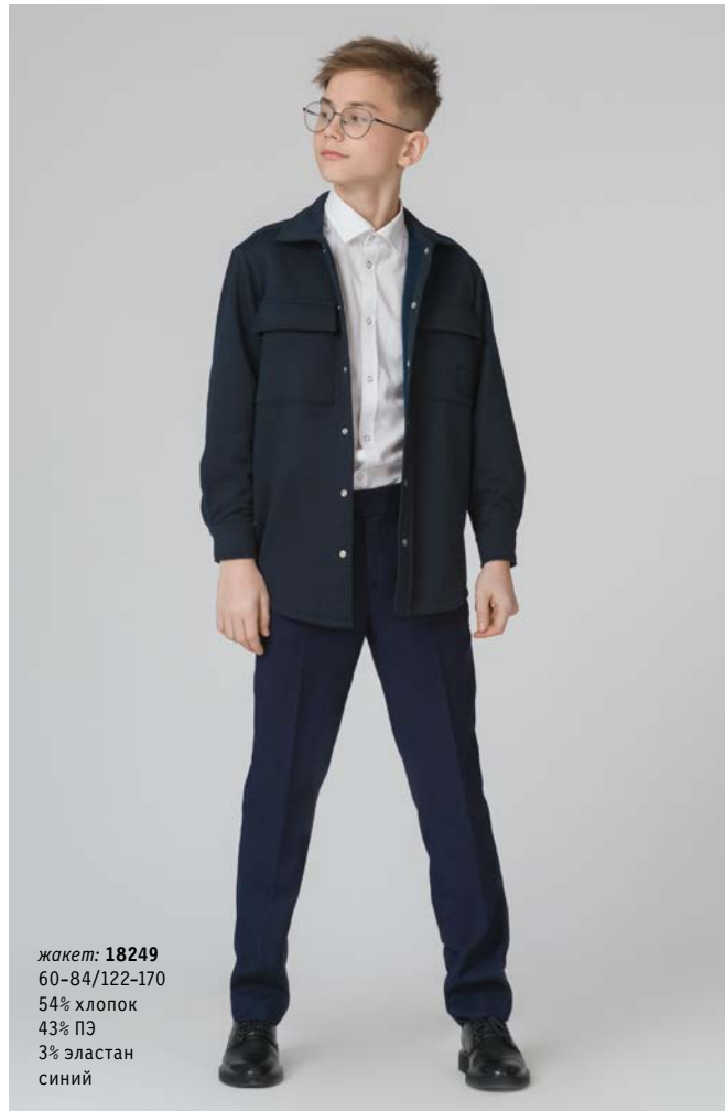
жакет: 18249 60-84/122-170 54% хлопок 43% ПЭ 3% эластан синий

Школьная коллекция ОАО «8 Марта» разработана для стильных и гармоничных учеников. Отличается современным дизайном, комфортом, сочетанием в одежде урбанистической культуры, «взрослой деловой» классики и элементов подростковой непосредственности. Коллекция включает как деловую одежду для школы "School", так и спортивную «Физ-ра».