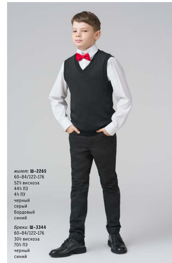
жилет: Ш-2265 60-84/122-176 52% вискоза 44% ПЭ 4% ПУ черный серый бордовый синий брюки: Ш-3344 60-84/122-176 30% вискоза 70% ПЭ черный синий