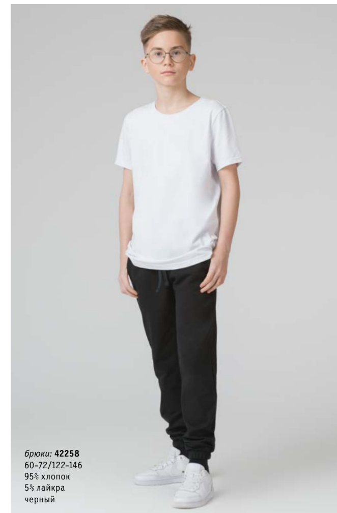
брюки: 42258 60-72/122-146 95% хлопок 5% лайкра черный