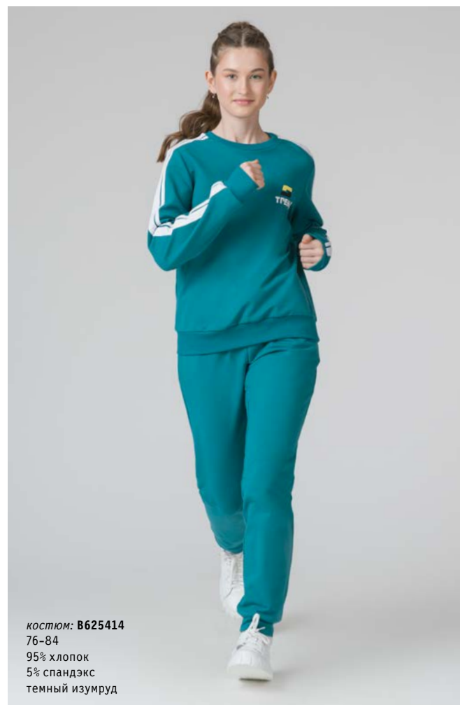
костюм: В625414 76-84 95% хлопок 5% спандэкс темный изумруд

Коллекция представлена актуальными практичными спортивными костюмами. Модели отличаются современным дизайном, удобными конструкциями, полотном, хорошо сохраняющим форму и насыщенность цвета. В качестве отделки используются молнии, канты и штучные печати.