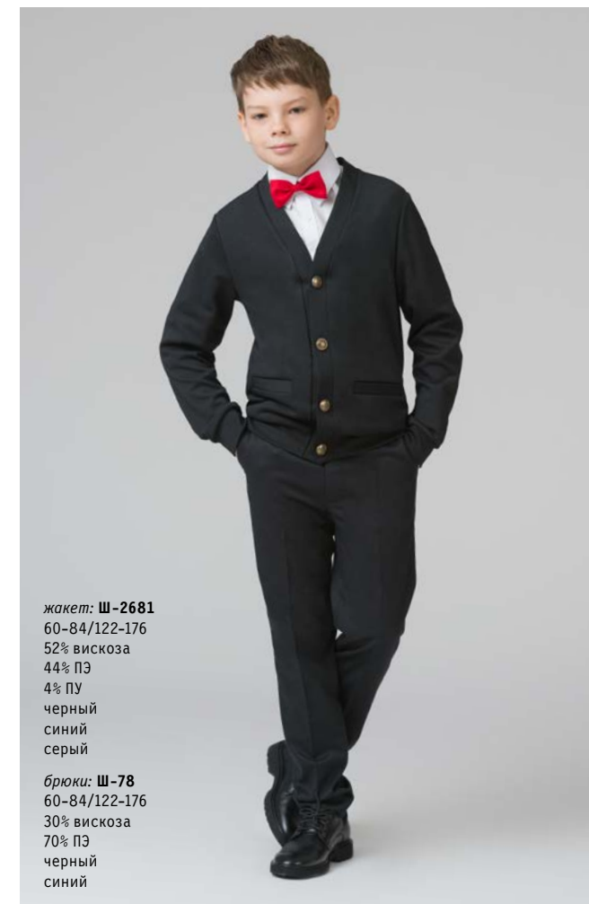
жакет: Ш-2681 60-84/122-176 52% вискоза 44% ПЭ 4% ПУ черный синий серый брюки: Ш-78 60-84/122-176 30% вискоза 70% ПЭ черный синий

Коллекция от ОАО «Жлобинская швейная фабрика» подарит Вам удобство, комфорт и радость!