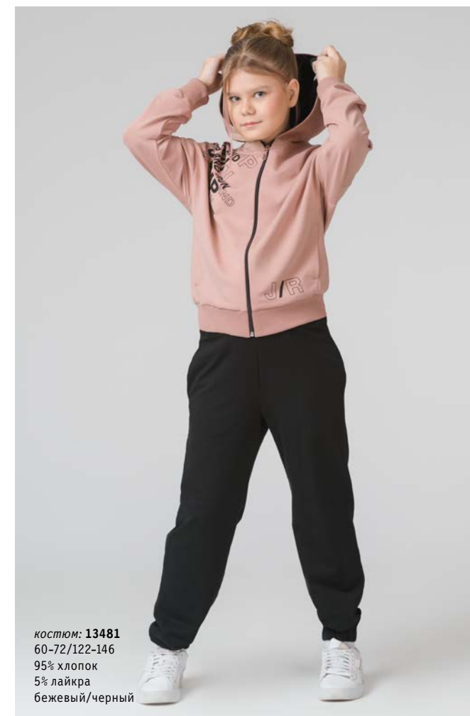
костюм: 13481 60-72/122-146 95% хлопок 5% лайкра бежевый/черный