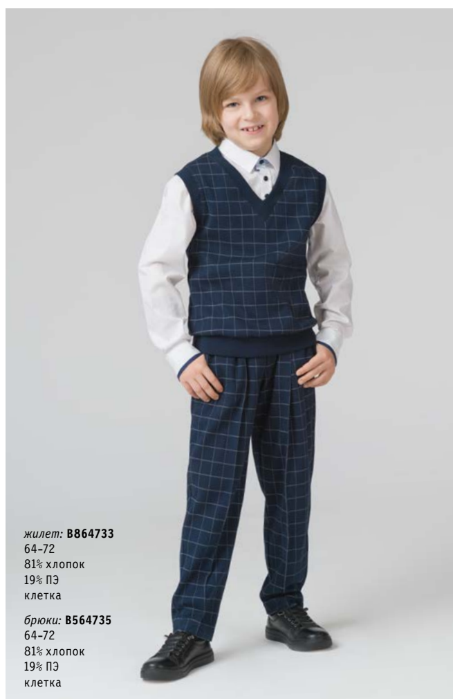
жилет: B864733 64-72 81% хлопок 19% ПЭ клетка

Одежда ОАО «СВІТАНАК» сочетает в себе современность, модный дизайн и высокое качество изделий по доступным ценам. Универсальность наших коллекций позволяет легко и просто комбинировать модели друг с другом и всегда выглядеть стильно и уверенно.